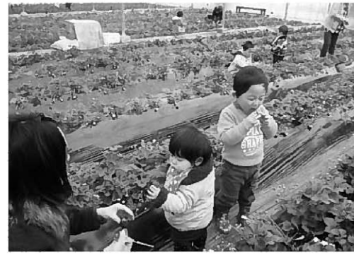
イチゴ狩りを楽しむ参加者