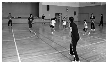
ドッジビーの様子②