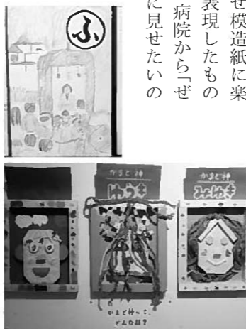
制作したかるた(写真上)とかまど神(写真下)

切り絵は、「クリスマス」などの季節のイベントをテーマにしたもので、これまで1年間かけて毎月5人で力を合わせて作り上げてきたものです。「雪の結晶」や「あじさい」など細かい切り絵を組み合わせ模造紙に染め、景色を表現したものです。市内の病院から「ぜひ患者さんに見せたいので病院に貼らせてください」というお話もいただきました。