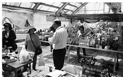
ガーデニング教室の様子

今後の事業予定をお知らせします。募集については後日広報やチラシなどで行いますので、皆さんの積極的な参加をお待ちしています。