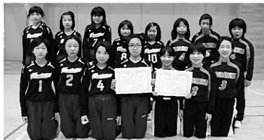
上位入賞した平泉・長島両バレースポ少

第22回めんこいテレビ杯小学生バレーボール新人大会一関地区予選が1月26日、一関市で開催され、当町の平泉バレースポ少が大活躍しました。 大会には一関地方から6チームが出場。総当たりのリーグ戦で優勝を競い、熱戦を繰り広げました。 同チームは、一関Vアタッカーズに惜しくも敗れたものの4勝1敗で、見事準優勝を勝ち取りました。