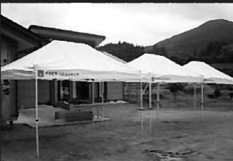
第19区自主防災会に整備された防災資機材

第19区自主防災会では、ワンタッチテント、毛布、災害用トイレ、災害用かまど、スコップなどの防災資機材を整備しました。整備された資機材は、地域の防災・減災活動に活用されます。