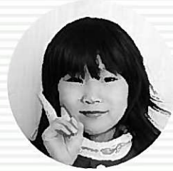
どきどきプリキュア 齊藤姫花ちゃん