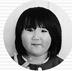
スマイルプリキュア 千葉あやちゃん