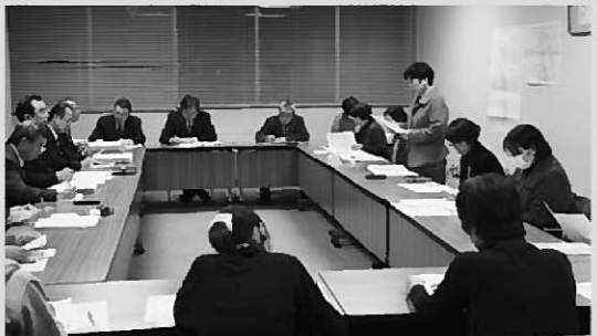
放射線対策について意見を交わした懇談会

懇談会終了に際し、町の未来を担う子どもたちのために、誠心誠意、取り組んでほしいと要望があり、懇談会を終了しました。