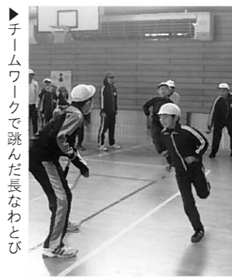
なわとび大会で見せた真剣な姿は、授業中にもありました。学年の修了にふさわしい態度ができています。長島小学校の児童です。

チームワーク。その結果、どの班も素晴らしい記録を出すことができました。また19日には、本年度最後の授業参観と懇談会がありました。授業への参観率は87%、長島小地区教育振興推進協議会の委員の方にも参加いただきました。