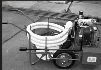
町婦人消防協力隊に整備された軽可搬ポンプ

平泉町婦人消防協力隊では、軽可搬ポンプ一式と訓練用標的、組み立て水槽を購入しました。今後、非常時に迅速に使用できるよう各種訓練や講習会などに活用されます。