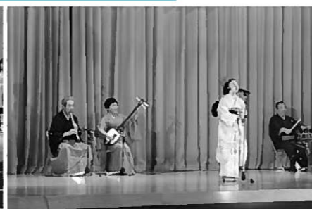
息のあった舞踊を披露する出演者(写真上) / 放課後児童クラブによる元気いっぱいのダンス(写真左) / 民謡の歌声は会場全体に響きわたった(写真右)