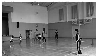
ドッジビーの様子①