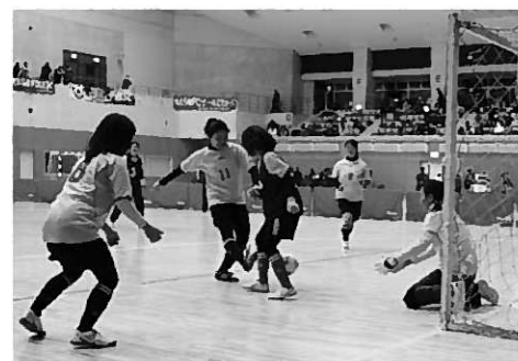
東山戦で追加点を挙げる平泉チーム

2013フランスポカップのせきフットサル大会が2月11日、一関市総合体育館で開催されました。 レディースの部には当町からラ・ミユウ平泉が出場し、優勝の快挙を成し遂げました。 4チームによる総当たりのリーグ戦で同チームは、全試合、チームワークの良さや巧みなパスワークで相手ゴールに迫り他チームを圧倒。2勝1分けで優勝を果たしました。 また、一般男女ミックスの部でも町内活動チームが大活躍。川嶋フットサルクラブが準優勝を、FC Zazaが準優勝を勝ち取りました。