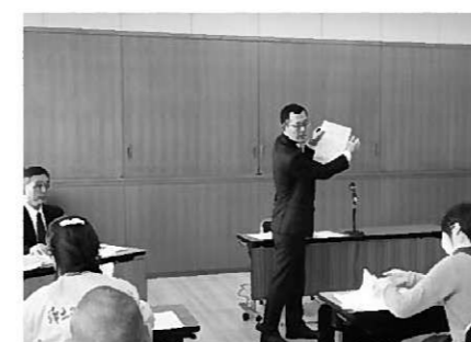
観光業風評被害損害賠償説明会

象とし、限定的な部分でしか認めていません。町としては、今後も県や関係市町村と連携を取りながら交渉をしていきます。 道路の放射線量を公表 文部科学省が走行サーベイ(車に測定機を搭載して道路上の空間線量を測定する方法)を活用して道路上の空間線量率を測定し分析した結果が2月19日から同省ホームページに公開されています。今回の調査により、町内の道路の空間線量率が明らかとなりました。 先に公表されている航空機モニタリングと同様、束稲山付近