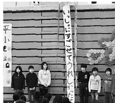
感謝の気持ちを表したメッセージ

2月19日に、6年生を送る会が行われました。どの学年も、お世話になった6年生に喜んでもらうために、少ない時間の中で一生懸命練習に取り組み、精一杯の演技や演奏、合唱を披露してくれました。