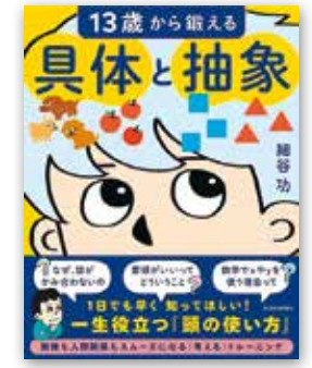
「13歳から鍛える 具体と抽象」 細谷 功/東洋経済新報社