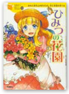
「ひみつの花園」 F・Hバーネット/Gakken