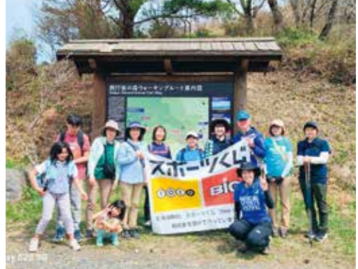
散策を楽しんだ参加者たち

西行桜の森を会場に4月14日、実施しました。今年は桜の開花に日程が重なり、花見を楽しみながらの散策となりました。