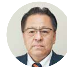
議長 高橋 拓生(56)