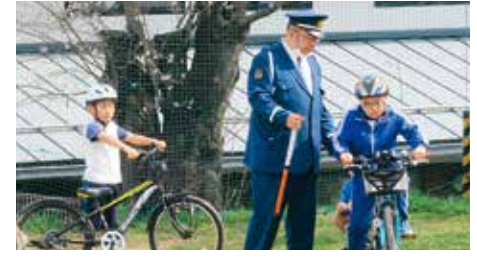
正しい自転車の乗り方を学んだ交通安全教室

12日には交通安全教室が行われ、1、2年生が道路の歩き方、3年生は校庭の模擬コースでの自転車の乗り方、4、5、6年生は実際に道路での自転車の乗り方についてそれぞれ学びました。