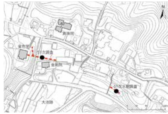
図1 中尊寺で見つかった古道の位置

これら2カ所で見つかった道路跡は、奥州藤原氏の政庁である平泉館(柳之御所遺跡)方面から金色堂へ向かう道路の一部と考えられます。12世紀の平泉の道路は路面が土のものが多くですが、寺院や柳之御所遺跡周辺では石敷が多く見つかるといわれています。