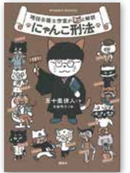
「にゃんこ刑法」 五十嵐律人/講談社