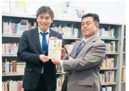
平泉商工会青年部さまからの寄贈