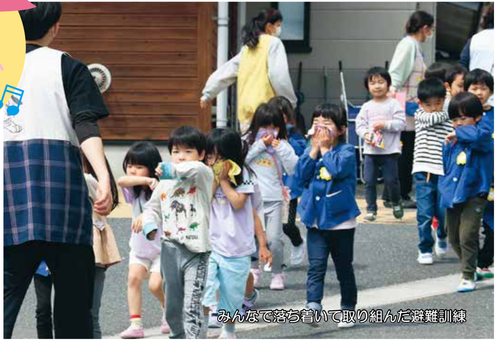
みんなで落ち着いて取り組んだ避難訓練