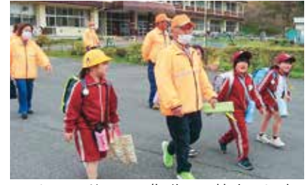
スクールガードの指導で下校する児童

4月は、安全な生活について学習する機会がたくさんあります。9日には集団下校指導を行いました。長島地区は見通しの悪いカーブや坂道が多くあり、担当の先生からは、通学路の危険箇所を確認することや安全な歩き方を学びました。その後教職員と一緒に、高学年を先頭に下校しました。16日は各地区のスクールガードの皆さんとの交流も良い、安全を守ってくださる皆さんをより身近に感じることができました。17日は少年消防クラブの入団式を行い、火事を絶対に起こしてはいけないという決意を新たにしました。