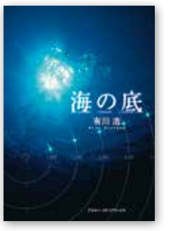
「海の底」 有川 浩/KADOKAWA