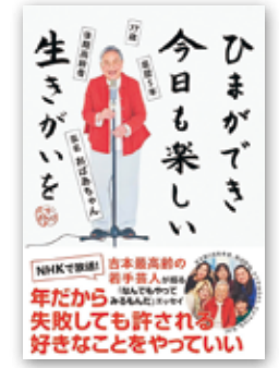
「ひまができ 今日楽しい生きがいを」 おばあちゃん/ヨシモトブックス