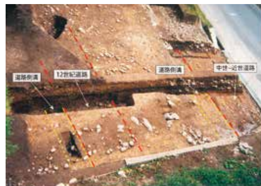
写真3 61次Ⅱ期調査の道路跡(西から)

左側の赤の点線が12世紀の道路跡で北側には道路側溝が見つかりました。また、右側の点線は中世～近世の道路跡で、南側は現道に壊されていますが北側では道路側溝が見つかりました。