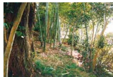
写真2 51次調査区付近に残る古道(西から) 現在でも地形として道路跡が残っています。