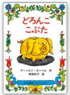
「どろんこぶた」 アーノルド・ローベル/文化出版局

「子ども読書の日」(4月23日)から始まった「こどもの読書週間(4月23日~5月12日)」に合わせ、企画展を開催しています。期間中は「ママもパパもこんな本を読んで大きくなったよ」をテーマに、絵本を中心に展示・貸し出ししています。ぜひ親子でもお楽しみください。