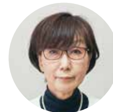
副議長 升沢 博子(73)