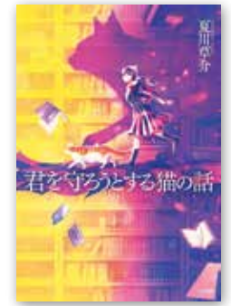
「君を守ろうとする猫の話」 夏川 草介/小学館