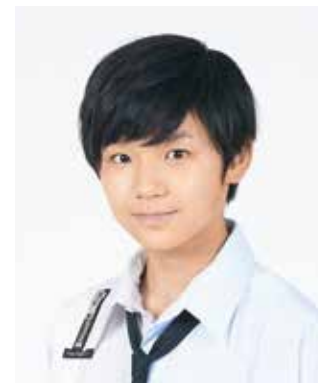
源義経公役 てらだ こころ 寺田 心さん