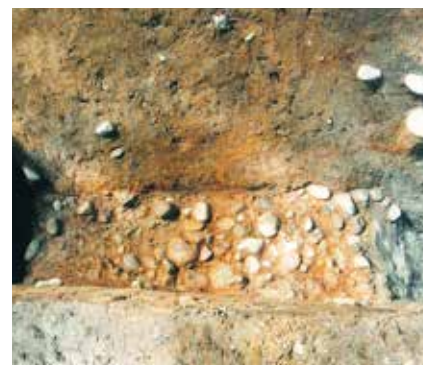
写真1 51次調査で見つかった石敷道路跡(東から)

左側の赤の点線が12世紀の道路跡で北側には道路側溝が見つかりました。また、右側の点線は中世～近世の道路跡で、南側は現道に壊されていますが北側では道路側溝が見つかりました。