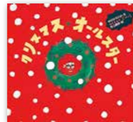
「クリスマス★オールスター」 村上 康成/童心社