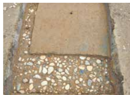
写真1 古い時期の石敷

写真1の石敷より石が小さいです。調査区中央から西側に広がっていましたが、観自在王院跡に近い東側では見つかりませんでした。