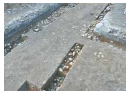
写真3 新旧重なる箇所

写真左下の古い時期の石敷が、中央側の新しい石敷の下側にもぐり続いている様子が分かります。