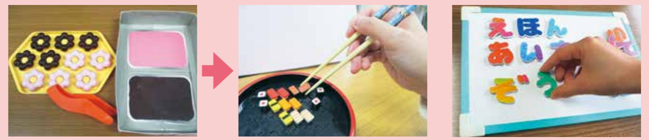
箸の持ち方など、段階的に練習します