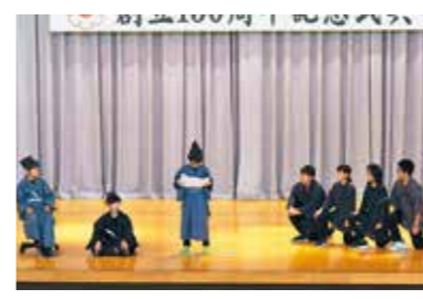
6年生の発表「浄土の心〜平泉物語〜」

本校の創立150周年記念式典を10月21日、開催しました。あいさつで校長先生は「一期一会、150周年の節目に巡り会ったことに感謝し、みんなでお祝いをしましょう」と呼びかけました。 記念発表では、各学年の出し物で150周年を祝いました。子どもたちは、多くの保護者や地域の皆さんに見守られ、練習の成果を発揮できました。1年生は、ちびっこ海賊団が元氣いっっぱいに宝を探す旅を演じました。2年生は、息の合った歌や踊りで「スイミー」の世界を楽しく表現。3年生は、「かえるとねずみの宅配便」の劇を通じ、協力や思いやりの大切さを伝えました。4年生は、合唱と合奏で素晴らしいハーモニーを響かせ、5年生は「夢」をテーマにした現代劇を、ユーモアを交えて演じました。6年生は、奥州藤原氏の歴史を劇にし、笑いあり感動ありの演技で、観客を引き込みました。 どの学年も節目にふさわしい発表でした。最後に全校児童で校歌を歌い、子どもたちの元氣な声が会場に響き渡りました。