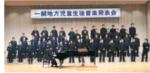
堂々と合唱を披露する3年生

一関地方児童生徒音楽発表会が11月9、10の両日、一関文化センターで開かれ、本校は10日午後の発表に参加しました。 本校では、文化祭の時に3年生のリーダーを中心として、自分たちの目指す合唱を考えます。それを実現するため、生徒たちが主体的に練習に取り組み、作り上げていきます。この取り組みを通して、素晴らしい合唱文化が下級生に引き継がれ、一歩ずつ進化しています。 3年生は音楽の楽しさを表そうと工夫して合唱を作り上げ、堂々と発表できました。手拍子や体を揺らしての演奏は、「思わず体が動き出す楽しい気持ち」が伝わります。 3年生は、学年全員の気持ちさがそろわないと難しい、動きを付けた発表に取り組んでくれました。来年度の3年生の発表にも、期待が膨らみます。