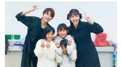
産業まつりでダンスを披露したメンバー