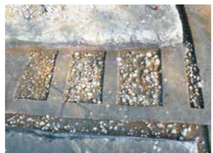
写真2 新しい時期の石敷

写真左下の古い時期の石敷が、中央側の新しい石敷の下側にもぐり続いている様子が分かります。