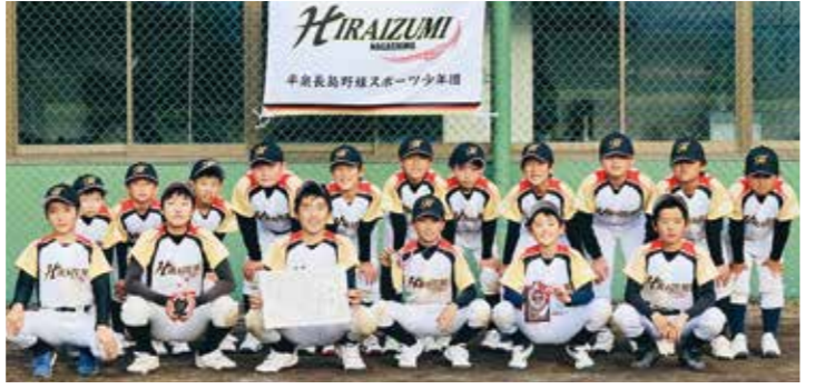
第23回町教育長杯学童野球大会で準優勝した平泉長島野球スポ少のメンバー

第23回町教育長杯学童野球大会は10月28、29の両日、長島球場で開かれました。町内や一関、奥州両市から8チームが出場し、熱戦を繰り広げた結果、平泉長島野球スポ少Ⅱ写真Ⅱが準優勝しました。 平泉長島スポ少は、1回戦で羽田スポ少(奥州市)に9-10で勝利。準決勝で山目スポ少(一関市)に、タイブレークの末、13-11で競り勝ちました。 決勝は、衣川スポ少(奥州市)に敗れましたが、精一杯のプレーを展開しました。