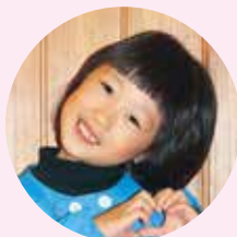
あいどる アイドル