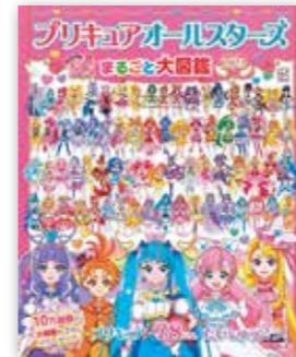
「プリキュアオールスターズ まるごと大図鑑 2023」 講談社