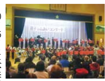
地域が一体となった合同演奏

第14回PTA親子ふれあいコンサートが11月11日、開かれました。長島保育所ばら組による鼓隊演奏、1〜3年生による合唱は、会場の皆さんが笑顔になる愛らしい発表でした。 本校合同団は、本年度の集大成、6年生にとって最後の演奏でした。後半は、本校卒業生を中心とした長島オールスターズの演奏です。今年流行した「アイドル」では、6年生がダンスを披露し、会場のボルテージが一気に上がりました。締めくくりは、4年ぶりとなる合同団との合同演奏で、90人が奏でる圧巻の演奏となりました。世代を超え、地域が一体となって音楽を創造する喜びを味わうことができました。 10月25日には、来年度の入学児童の保護者を対象とする家庭教育学級がありました。元岩手大学非常勤講師の吉田智子さんから「土台を固めて入学の日をこのテーマで、睡眠の重要性について講演いただきました。 午後8時に就寝すること、睡眠中に成長に役立つさまざまなホルモンの分泌がなされるというお話を、ユーモアを交えながら分かりやすく説明していただきました。