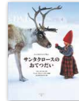
「サンタクロースのおてつだい」 ペール・ブライハーゲン/ポプラ社