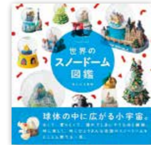
「世界のスノードーム図鑑」 カルロス矢吹/産業編集センター