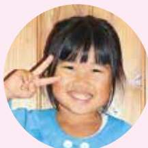
あいすや アイス屋さん