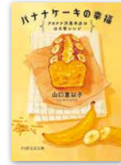
「バナナケーキの幸福」 山口 恵以子/PHP研究所