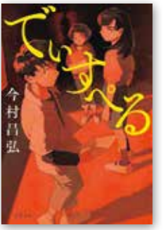
「でいすべる」 今村 昌弘/文藝春秋