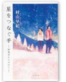
「星をつなぐ手」 村山 早紀/PHP研究所