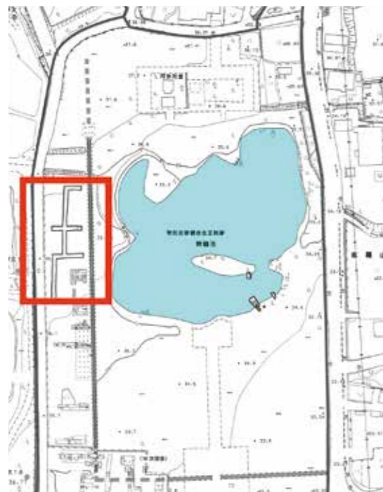
図1 観自在王院跡と調査地点(赤枠部分)

観自在王院跡と毛越寺との間には、幅30㍍の南北道路跡があります。路面に3㍍20㍍の石が敷かれ、貴人の乗り物である牛車の駐車場「車宿」があることがこれまでに分かっています。本年度は車宿の北側で発掘調査を行い、これまで1