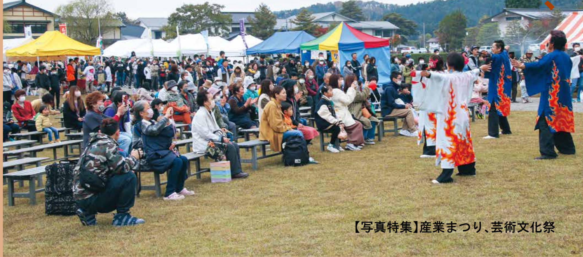
【写真特集】産業まつり、芸術文化祭