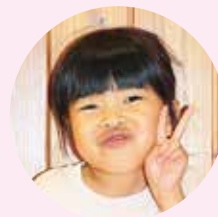
やくるとや ヤクルト屋さん