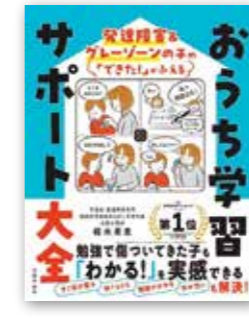
「おうち学習サポート大全」 植木 希恵/主婦の友社