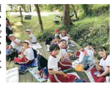
大文字キャンプ場での全校遠足

9月15日、大文字キャンプ場への全校遠足を実施しました。この遠足は縦割り班で交流する野外活動で、子どもたちがとても楽しみにしている行事です。9月は発熱や胃腸炎などで体調を崩す児童が多く、当日も欠席者がいました。また、今年は厳しい暑さで屋外での学習活動が制限されることが多く、子どもたちの体力低下が心配される中での実施でした。それでも5、6年生の励まし、6人のボランティアの皆さんの協力があり、全員が大文字キャンプ場まで歩き通すことができました。 キャンプ場到着後、おやつの時間を取りました。この日のためにおやつを作った児童も多く、格別の美味しさに笑顔いっぱいの子もたちでした。その後は全校児童が2班に分かれ、高学年企画のレクを楽しみました。じゃんけん列車やハンカチ落としゲーム、秋探し散策をするなど、眼下に広がる素晴らしい景色を満喫しながら、学年の垣根を超えて交流できました。 体力の増進、協力・協調の心を養うこと、正しい集団行動ができること。多くの狙いを達成できました。同行いただいたボランティアの皆さんに感謝申し上げます。