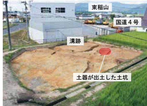
写真2 宿遺跡第8次調査 全景(南西から)