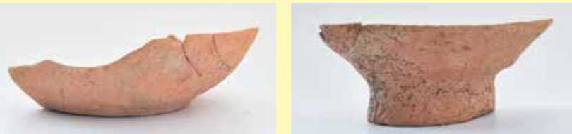
写真1 ロクロかわらけ(左)と柱状高台(右)