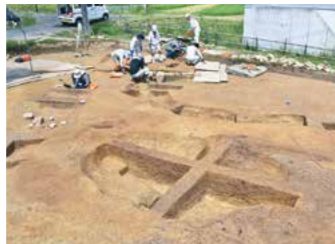
写真3 土器が出土した土坑(南東から)

6～8月に行った宿遺跡の発掘調査で「ロクロかわらけ」と「柱状高台」の2種類の土器が出土しました。12世紀の土器よりも古い特徴があり、11世紀後半の安倍・清原氏から12世紀の奥州藤原氏時代初め頃の土器と推定されます。 調査地点は国道4号から高田前工業団地に向かう町道に面した水田で、土坑4基と溝跡5条が見つかりました。写真2は土器が出土した土坑の直徑約3・6尺の楕円形の土坑で、中央部を5センチほど掘りくぼめ、人為的に埋め戻してあります。写真3は