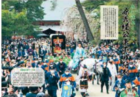
令和5年全国広報コンクール「広報写真(一枚写真部)」で入選した写真。本紙令和4年6月号2～3頁。