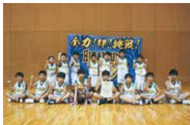
初優勝した「平泉 GOLDEN KID'S」のメンバー