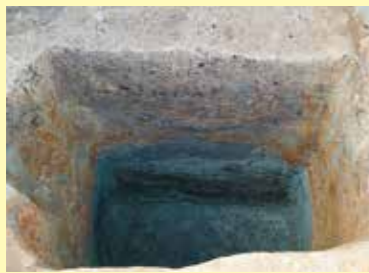
写真4 トイレ状遺構断面(東から)