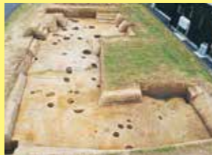
写真1 調査区全景(南から)