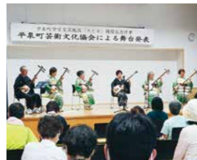
芸術文化協会の舞台発表