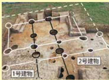
写真2 1・2号掘立柱建物跡(西から)