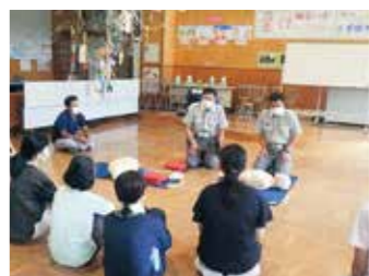
応急手当について学んだ講習会

長島小学校では、夏休みに向けて防災意識を高めるため、さまざまな取り組みをしています。 PTA主催の「応急手当講習会」が7月6日に開かれました。参加した保護者と教職員は、講習で「あらゆるケースを想定した周囲の人たちとの連携法」「心停止の早期認識と通報」「一次救命処置(心肺蘇生とAED)」などを教わり、真剣な表情で応急手当での訓練に取り組みました。 夏休みは3年ぶりにプールを開放し、地域の人たちに監視当番として協力してもらうことになっていきます。万が一の事故に備え、応急手当の方法を学ぶ講習会を今後も企画していきます。 7月19日には、不審者が校内に侵入したことを想定して避難訓練を実施しました。一関警察署の署員を講師に招き、避難や誘導の仕方、防犯標語「いかのおすし」を学び、関係機関との連絡体制や教職員の役割分担を確認しました。児童は真剣に訓練へ臨み「不審者が侵入した場合は訓練を思い出し、行動したい」などと振り返りました。 夏休みも「いかのおすし」を守り、安全に生活してほしいと願っています。