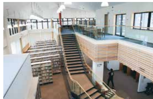
「エピカ」は1階に図書館や多目的スペースがあり、2階は学習スペースのほか、公民館機能として研修室などが備わる