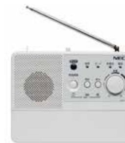
防災行政無線戸別受信機