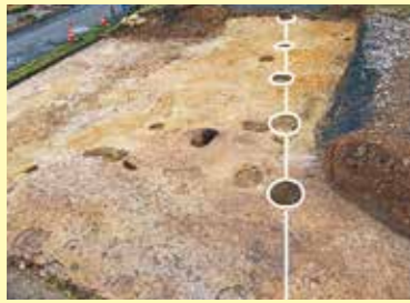
写真3 町道際の様子(西から)