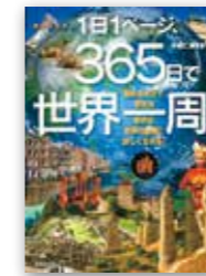
「1日1ページ、365日で世界一周」 井田仁康監修/成美堂出版

8月の企画展は、「サマースタイル・平泉」と題して実施予定です。夏を楽しく過ごすための本を選び、展示や貸し出しを予定しています。ぜひ利用してください。一部を紹介します。