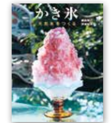
「かき氷 天然氷をつくる」 岩崎書店