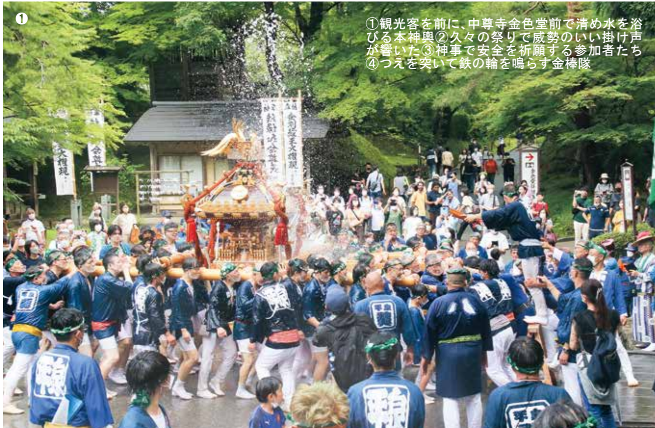
①観光客を前に、中尊寺金色堂前で清め水を浴びる本神輿②久々の祭りで威勢のいい掛け声が響いた③神事で安全を祈願する参加者たち④つえを突いて鉄の輪を鳴らす金棒隊