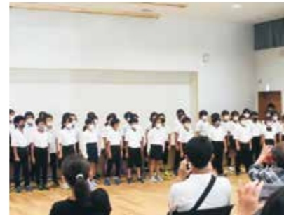
平泉小学校の児童による合唱

ワークショップや舞台発表、ニュースポーツ体験など、盛りだくさんの内容でした。多くの方に来館いただき、とても盛況でした。