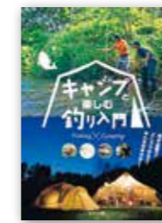
「キャンプと楽しむ釣り入門」 つり人社