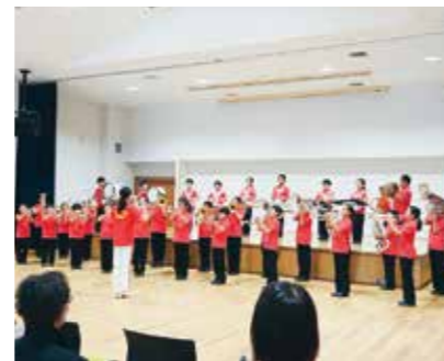
長島小学校の児童によるマーチング