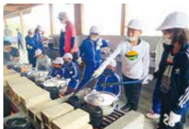
協力してカレー作りをする児童

5年生が6月24、25の両日、宿泊学習を陸前高田市の県立野外活動センターで行いました。活動のテーマを「環境への気付きや持続可能な開発目標(SDGs)のヒントを学ぼう」「自然や他者との関わりから自主性・責任感・実行力を学ぼう」とし、有意義な2日間にするために事前学習や集合・整列の仕方、時間を守って行動することなど、たくさんの準備や心構えをしました。 当日は雨が降りそうな天気の中、保護者に見送られて学校を出発。子どもたちのパワーで雨雲を吹き飛ばし、全員で力を合わせ、野外炊事でのカレー作りや磯遊び、キャンプファイヤーに取り組みました。