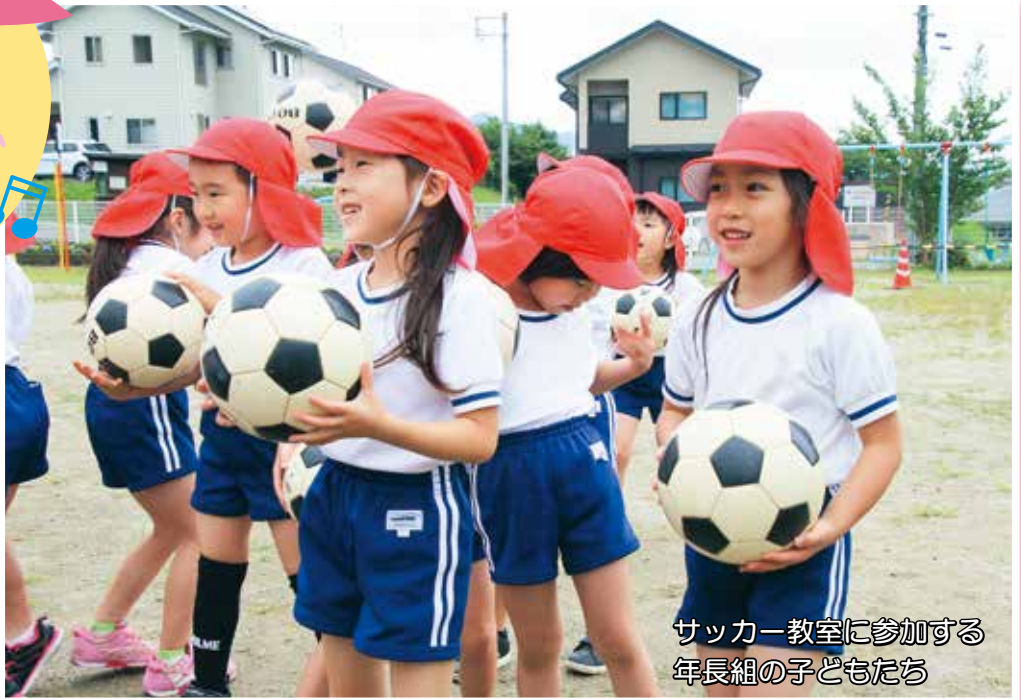
サッカー教室に参加する 年長組の子どもたち