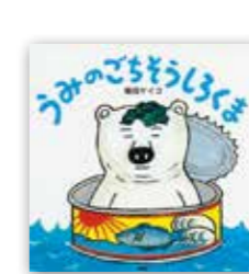
「うみのごちそうしろくま」 柴田ケイコ/PHP研究所