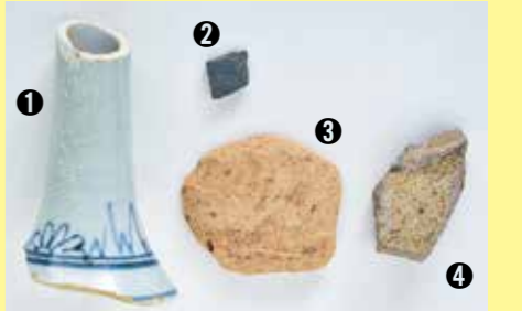
①肥前産染付磁器瓶 ②須恵器 ③かわらけ ④常滑産甕

江戸時代の陶磁器のほか、平安時代の須恵器、12世紀のかわらけ、常滑産陶器の甕の破片が出土しました。