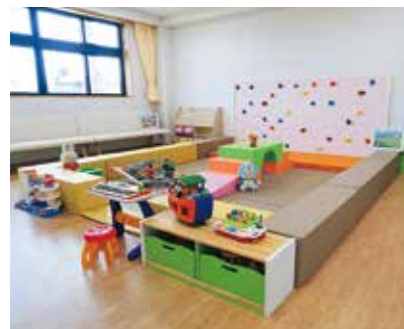
「エピカ」のキッズスペース