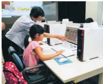
パソコンキッズスクールの様子