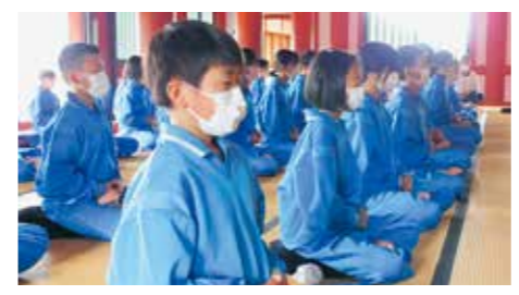
座禅を体験する平泉中の生徒

6月7日、毛越寺本堂で座禅体験を行いました。小雨が降り、雨音がしとしとと響く静寂の中、生徒たちは足を組み「心を無にする」体験をしました。僧侶が醸し出す厳かな雰囲気を感じ、学校とは違う空間に身を委ねる、とても良い時間を過ごすことができました。 生徒たちは、小学校、中学校一環で「平泉学」を学習しています。中学1年生では平泉の歴史を学ぶ平泉検定、平泉遠足や座禅体験、写経体験、発掘調査体験を行います。2年生では平泉学講演会で、平泉に関する研究者を講師に話を聞きます。3年生では、夢あかりや世界遺産キャンパルの制作を通して学ん