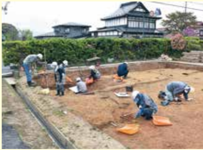
写真3 発掘調査の様子