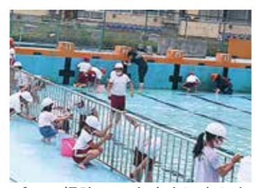
プール掃除に汗を流す児童たち

プール開きを控えた6月上旬、全校児童でプール清掃を行いました。どの児童も、作業分担に従って一生懸命に掃除を行いました。その後、プールの水かさが増えるにつれ、子どもたちの「わくわく度」も高まっていくようでした。 6月7日のプール開き。体育主任や養護教諭からプールの使い方について話があり、その後、各学年の代表が今年度の水泳の目当てを発表しました。今年度はたくさんプールに入り、児童の泳力を伸ばしていきたいと考えています。今年も安全に水泳学習ができることを願います。 6月に入り、学校の昇降口は、きれいな花々で彩られています。環境美化委員と4年生たちが育