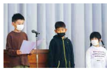
水泳学習での目標を発表する児童

5月下旬、4、5、6年生が一生懸命プール掃除をしました。また、全校の代表が誓いの言葉を発表し、みんなが約束を守って楽しい水泳学習にすることを約束しました。 プールの開きの6月7日、全校児童が参加してプール開きの式を行いました。校長先生や体育担当の先生、養護教諭の先生から水泳学習に臨む際の心構えや約束、注意点などについて話がありました。児童たちは真剣な表情で話を聞き、水泳の学習を通して自分の目当てや目標に向かって精一杯頑張ること、自分の命を守ることの大切さを確認しました。 2、4、6年生の代表は、今年度の水泳学習で楽しみにしていることや頑張りたいことを大きな声で堂々と発表しました。