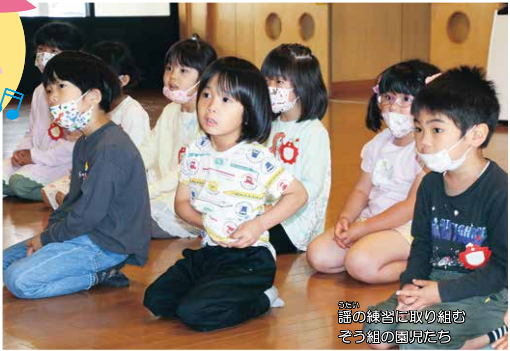
うたい 謡の練習に取り組む そう組の園児たち