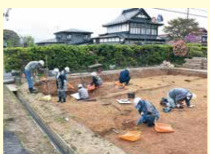
写真3 発掘調査の様子