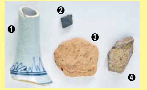
①肥前産染付磁器瓶 ②須恵器 ③かわらけ ④常滑産甕

江戸時代の陶磁器のほか、平安時代の須恵器、12世紀のかわらけ、常滑産陶器の甕の破片が出土しました。