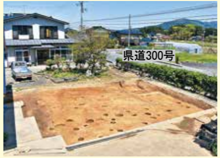
写真1 調査区全体(南西から)