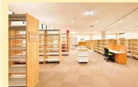
約4万2000冊の図書資料が皆さんの利用をお待ちしています。