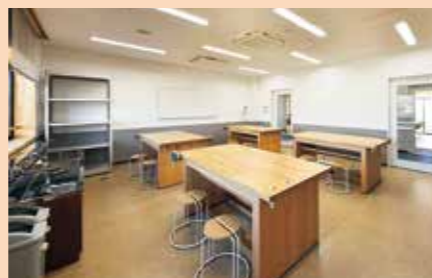
絵画、工芸、陶芸などの教室、体験学習などで利用できます。(定員16人)