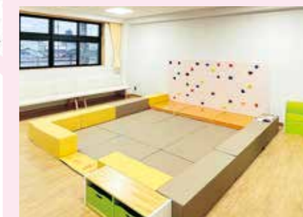
幼児(～3歳ごろ)を対象としたキッズスペース 子育て世代の交流の場として、キッズスペースや交流室、相談室などを利用できます。