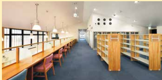
図書の閲覧や勉強ができるスペースです。(14席)