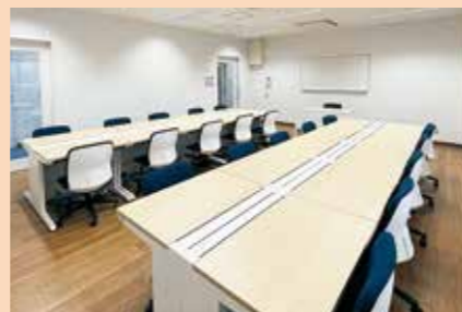
パソコン教室などで利用できます。(定員20人)