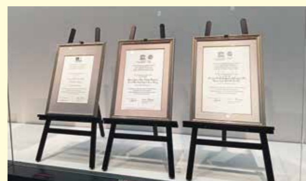
写真3 3つの世界遺産の登録認定証

「橋野鉄鉱山」とあわせて、岩手県内の世界文化遺産は奈良県と並び、国内最多の3件となりました。今回の企画展では「北海道・北東北の縄文遺跡群」「明治日本の産業革命遺産」「平泉」の概要について、パネルにより紹介するとともに、推薦書(写真2)や世界遺産登録認定証(写真3)を展示しています。また、企画展開催中に橋野鉄鉱山・御所野遺跡に関する特別講座を予定しています。推薦書や世界遺産登録認定証は展示される機会が少なく、登録認定証が3つ揃うことは貴重な機会ですので、ぜひご覧ください。 (県立平泉世界遺産ガイドランスセンター)