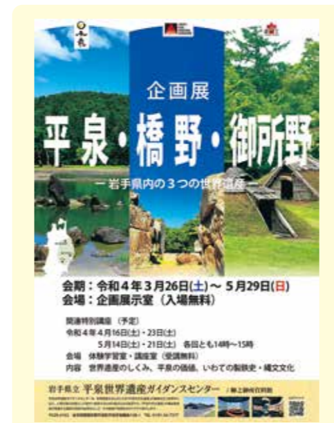
写真1 企画展ポスター

ガイドランスセンター は、道の駅平泉の向かいにあるケロ！ ケロ平 designed by センウエンル