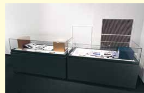
写真2 「平泉」と縄文遺跡群の推薦書

世界遺産に登録になった際の認定証です。左から「北海道・北東北の縄文遺跡群」「明治日本の産業革命遺産」「平泉」になります。