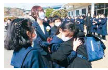
後輩との別れを惜しむ

3月12日、平泉中学校第46回卒業式を挙行しました。本年度は、在校生を卒業式にぜひ参加させたいと考え、感染対策を徹底しながら、180人を超える生徒たちによって卒業式を開催することができました。 卒業生は、コロナ禍のため先輩たちの卒業式には参加できず、平泉中学校の卒業式はどのようなものなのか知りませんでした。 そのような状況でも伝統的に行われてきた構成詩に自分たちの思いを込め、合唱に気持ちを込め、引き継いでいく後輩に平泉中学校の伝統を継承してくれました。その思いは、しっかりと1、2年生に伝わったと思います。