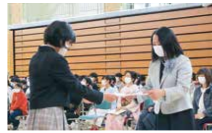
「ありがとう」の気持ちを込めて

3月18日、卒業証書授与式を挙行し、49人の卒業生は、6年間の思いを胸に堂々と式に臨みました。 校長先生からの卒業証書授与の後、すぐに保護者へ卒業証書を渡し、礼をする卒業生の姿には「ありがとう」という感謝の気持ちが表れていました。 「旅立ちの言葉」では、一人ひとりが6年間を振り返り、自分自身の成長や思い出について言葉一つ一つに気持ちを込めて