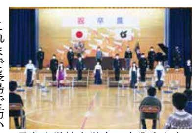
長島小学校を巣立つ卒業生たち

3月18日「第45回卒業証書授与式」を挙行しました。保護者と4・5年生、来賓、教職員が見守る中、18人の6年生が小学校を巣立ちました。 担任の呼名にしっかりと応え、校長先生から卒業証書を受け取る卒業生の凛とした姿は、小学校での最後の授業にふさわしいものでした。 また、卒業生の後ろ姿をじっと見つめる在校生からも、これから伝統を受け継いでいくのだという意気込みが感じられました。合奏団の演奏や合唱で卒業生を送ることはできませんでしたが、ピアノ演奏と盛大な拍手で卒業生の門出をお祝いしました。優しい音色が会場を包み込み、集った人々の心に響きました。