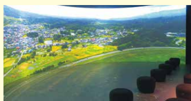
写真1 プロローグシアター 「浄土体感映像」と「世界遺産平泉ガイダンス映像」を毎時3回(0分、20分、40分)放映しています。

「平泉の文化遺産」周遊の拠点施設として、令和3年11月20日に平泉世界遺産ガイダンスセンターがオープンしました。「平泉を掘る」では、4回にわたって施設の展示内容を紹介していきます。 1回目は、世界遺産コーナーについて紹介します。世界遺産コーナーは、世界遺産に登録された資産と関連する遺跡の紹介をはじめ、奥州藤原氏による現世の仏国土(浄土)の表現とその歩みを探ります。