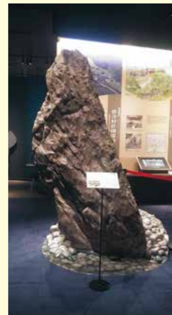
写真3(左) 毛越寺庭園の立石

奥州藤原氏初代清衡の平和な世界を作るという想いを世界遺産平泉の始まりの象徴として展示しています。