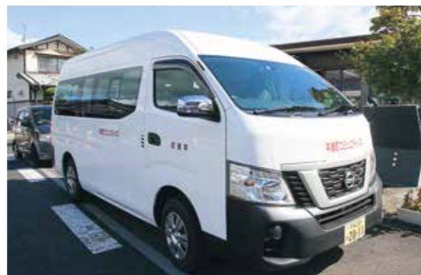
長島ルート車両(白)