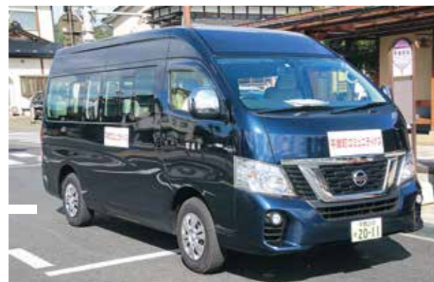
平泉ルート車両(青)

コミュニティバスについては、令和3年6月より運行していますが、町民の皆さんが親しみを持てるようにコミュニティバスの愛称を募集します。(平泉ルート・長島ルートで同じ愛称の募集です)