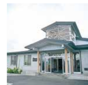
悠久の湯平泉温泉