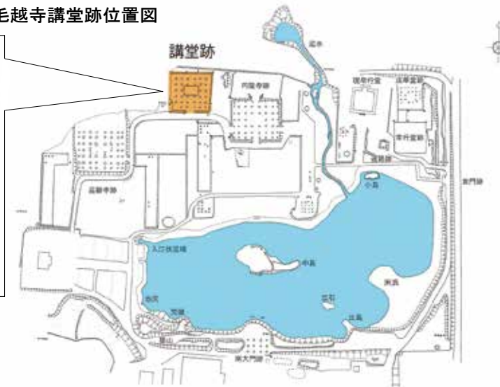
毛越寺講堂跡位置図

写真中央に厚い板状に切られた石を2列に並べており、石列の間に屋根から落ちる雨水を受けて流す様になっています。右側の石列がお堂の基壇側面にあたり、左側が外側にあたりますが、崩れているため位置が乱れています。さらに外側には細かい石が敷かれていました。