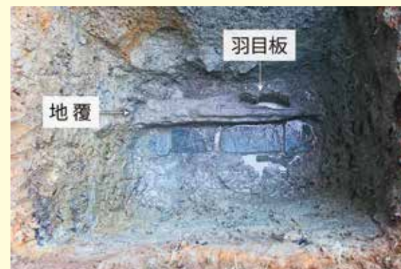
写真2 北西部 西辺 基壇を覆う部材の様子(西から)

基壇の高さ(厚さ)は90センチ程あり、その上に長さ1メートル、厚さ40センチを超えた大きさの礎石が据えられていました。