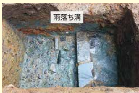
写真1 北西部 北辺 雨落ち溝の様子(西から)

調査では①お堂を囲む雨落ち溝、②木製の羽目板や地覆などの基壇を覆う部材、③基壇の造り方等を確認しました。