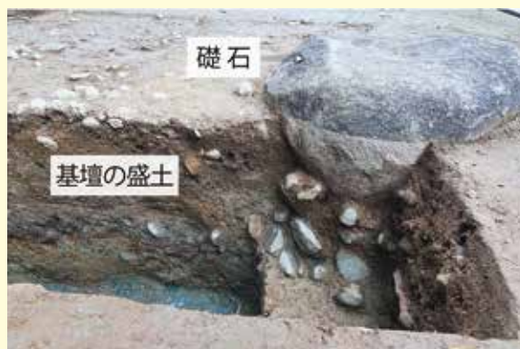
写真3 北側中央 礎石と基壇の様子(西から)

お堂の基礎は、石混じりの土を積み上げて高く盛って、その上に柱を支える礎石が据えられていました。