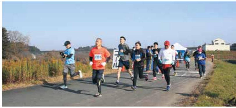
8区の部スタートの様子

「平泉の文化遺産」の世界遺産登録10周年と北上川遊水地事業の早期完成を祈願して、11月21日に長島地区の北上川堤防で平泉町ウォーク&ランを開催しました。 種目はウォーキングとランが2キロ、4キロ、8キロで長部揚水機場付近を発着点として秋晴れの下、町民など95人が参加しました。