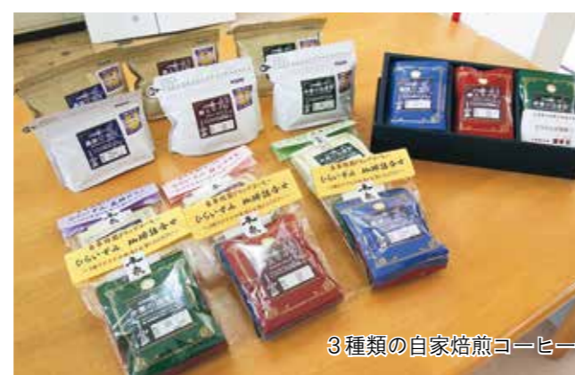
3種類の自家焙煎コーヒー