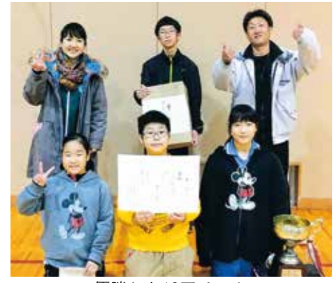
優勝した13区チーム

地域と親子の絆を深める良い機会のため、各チームとも地区公民館などで練習を行い、準備を進めて当日の大会に臨みました。 大会結果は次のとおり ▽優勝: 13区 ▽準優勝: 5区 ▽3位: 10区