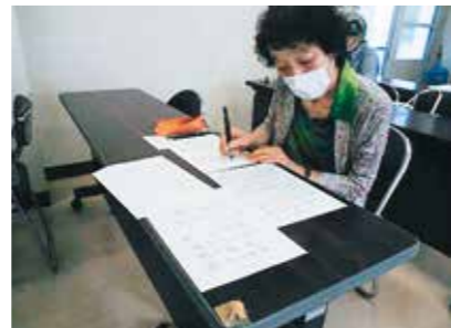
今年こそは手書きで!

全6回シリーズの最終回は、年賀状の書き方を学び、先生からの「ぜひ手書きで出して」との言葉を受けて、受講生は真剣に練習に励みました。