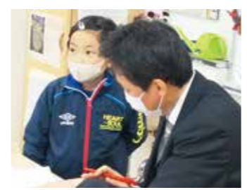
テストは職員室でも

5の段、2の段など、最初のうちは順調に合格していくものの、6の段、7の段のあたりから、1度のテストでは合格できない子が増えました。 それでも自分が苦手と感じているところを繰