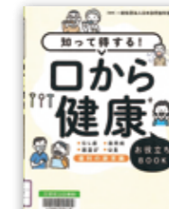
「知って得する! 口から健康」 吉久 健一 現代書林