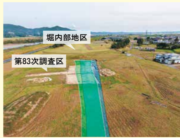
写真1 高館方向から見た柳之御所遺跡 中央の草の生えていない部分が第83次調査区。その奥には公園となっている堀内部地区が見えます。これまでの調査で確認された「旧道路跡(青)」と「新道路跡(緑)」を示しています。

本年度は、東側の堀内部地区に近い部分の調査を行いました(写真1)。その結果、堀内部地区と堀外部地区を分ける堀跡を起点に、中尊寺方向へ延びる道路跡が連続していることがわかりました(図1)。さらに