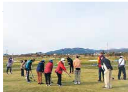
うまく打てるかな~?

11月18日、気仙沼市パークゴルフ場で3回目の教室を開催しました。天候にも恵まれ、受講生10人はパークゴルフの魅力堪能しながら、爽やかな汗を流しました。