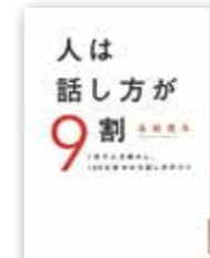
「人は話し方が9割」 永松茂久/すばる舎