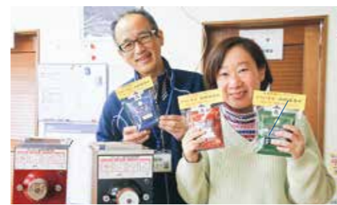
コーヒーを紹介してくれたたけとんぼの皆さん

たけとんぼでは、生豆の選別から自家焙煎、袋詰めまで全て手作業で行っています。 ※ご贈答用の注文は、たけとんぼまで