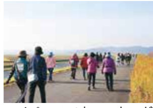
マイペースでウォーキング