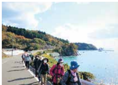
海も紅葉もきれいだね

11月4日、南三陸町の歌津泊崎半島で実物の魚竜化石なども見学しながら、受講生12人で秋晴れの海岸線をウォーキングしました。