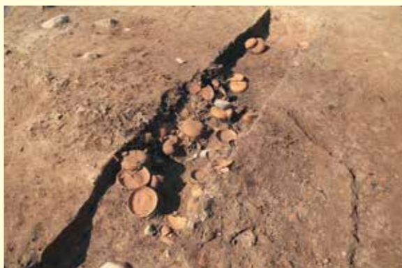
写真3 かわらけの出土状況 かわらけ集中からは完形やほぼ完形のかかわらけが多く見つかりました。これらのかかわらけを調べることで、このかわらけ集中がいつ頃できたのか分かってきます。

道路跡に重なってかわらけ(土器)が集中して見つかっています(写真2・3)。これらのかかわらけ(土器)の編年を調べることで、道路跡の年代を検討する手がかりが得られました。 この他にも、道路跡と直交する溝跡や建物の柱跡の一部が見つかり、堀外部地区の様相を検討する上で重要な情報が得られたと考えています。これからも奥州藤原氏の政庁跡とされる柳之御所遺跡の整備に向けた調査を継続していく予定です。 (岩手県立平泉世界遺産ガイドランスセンター)