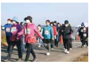
ウォーキングの部