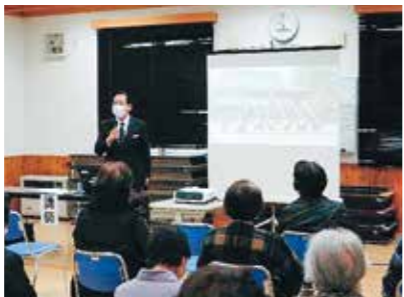
高齢者学級の様子

「コロナと心の健康」と題した講演会は40人が受講し、コロナウイルスへの不安、ストレスが心身にもたらす影響、心の健康を保つポイントについて理解を深めました。