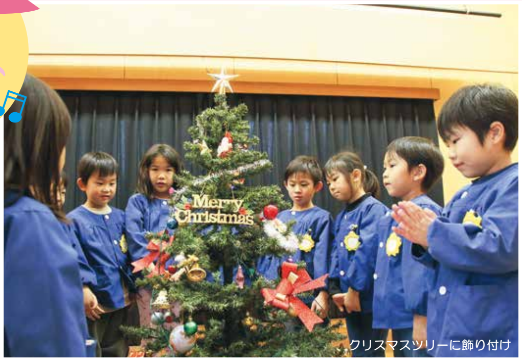
クリスマスツリーに飾り付け