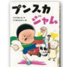
「プンスカジャム」 くどうれいん/福音館書店