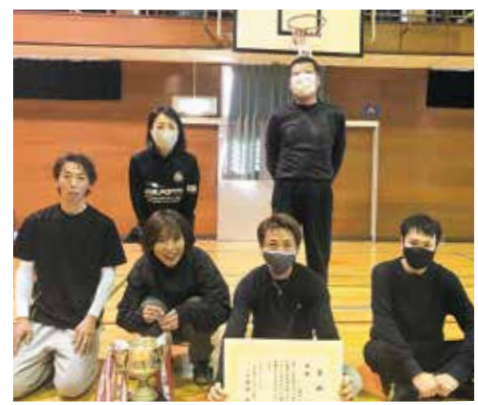
2連覇した10区チーム

地区の親睦と運動不足解消にとっても良いと評判の大会なので、機会があったらぜひご参加ください。 大会結果は次のとおり ▽優勝: 10区 ▽準優勝: 16区 ▽3位: 9区、11区