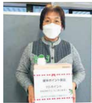
「健幸ポイント」20P達成者 第1号