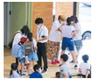
確認してから引き渡し！

6月11日に「引き渡し訓練」を実施しました。通常の避難訓練と同じように、子どもたちが自分の生命を守ろうという意識を高め、その方法を身につけることが大きなねらいです。