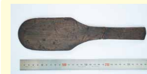
写真3 しゃもじ 長さは約30センチです。現在のしゃもじと大きく形は変わっていません。