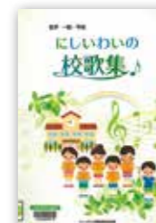
「岩手・一関・平泉にしいわいの校歌集」 トーバン印刷株式会社