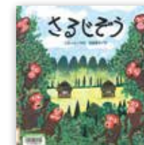
「さるじぞう」 斎藤隆夫/あすなろ書房