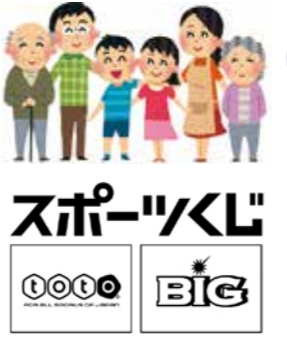
平泉町総合地域型スポーツクラブ 設立準備委員会は、スポーツ振興くじ助成金を活用し活動しています

平泉町総合地域型スポーツクラブ設立準備委員会では、市民の運動機会の場を提供する事業として、毎月第1・第3水曜日に平泉中学校柔剣道場で、ニユースポーツやレクリエーションなど軽い運動を行う「ホップステップオール」を開催しています。年代などの限定はありませんので、ちょっとした気晴らしに参加してみませんか。