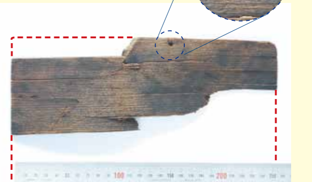
写真2 折敷(食器などを乗せるお盆) 写真の面に2本の傷、この裏面には4本の傷がついています。 (赤の破線部分が完全な状態の折敷の形)