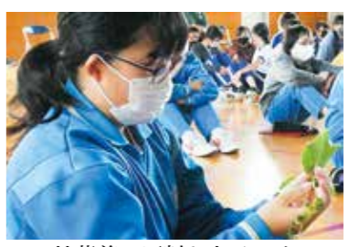
甘葛煎の原料となるツタ