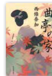
「曲亭の家」 西條奈加/角川春樹事務所