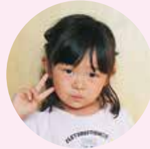
プリキュア ちば 千葉ひかりちゃん