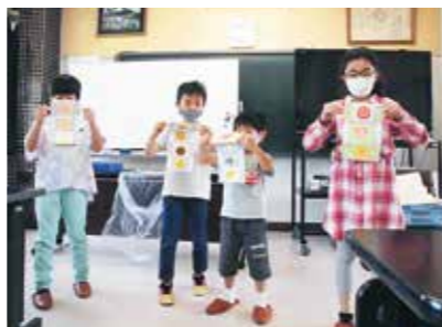
上手にできました!