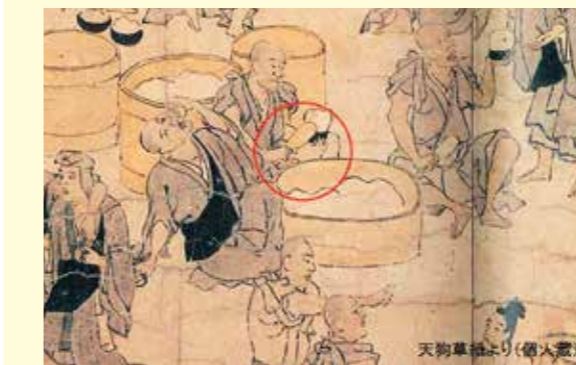
写真4 天狗草子(鎌倉時代の絵巻物)に描かれたしゃもじ