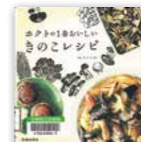
「ホクトの1番おいしいきのこレシピ」 ホクト(株)監修/池田書店