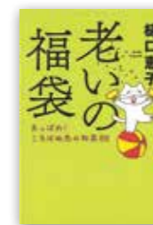
「福袋」 樋口恵子/中央公論新社