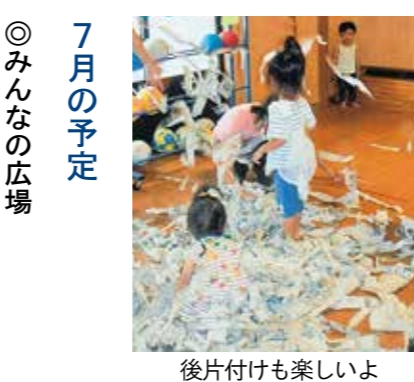
後片付けも楽しいよ

7月の予定 ◎ みんなの広場 「野菜スタンプで遊ぶ」 いろいろな野菜のスタンプで遊びましょう。 ▽日時：7月20日(火) 午前10時～午前11時 午前9時30分受付 ▽場所：平泉保育所・町立幼稚園ホール ▽対象：1歳～在宅児 ▽持ち物：水筒、スタンプに使う野菜