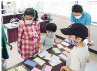
屏風の柄はどれにしようかな

親子4組が参加し、木で作る古風で楽しいおもちゃ「パタパタ屏風」を作りました。参加した4組は、苦労しながらも、全員上手に完成となりました。