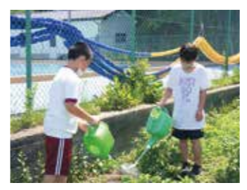
ハウセンカに水をあげる6年生

4年生は中尊寺菊祭り出品のため、一人一鉢の菊作りが始まりました。菊の花の皆さんから指導を受け、ずつしりとした鉢に腐葉土と肥料を入れ、丁寧に菊を植えました。昇降口前のプランターのお花は、人権擁護委員の皆さんを中心に植えていただきました。