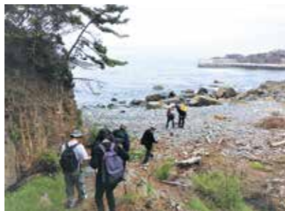
黒崎の砂利浜にて

5月19日、広田半島先端の黒崎をめぐってウォーキングしました。普段の生活とは違った空間を楽しみながら、リフレッシュできたことと喜んでいました。