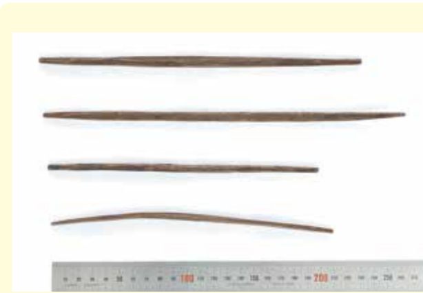
写真1 箸 両端が細く削られており、側面も面取りされています。長さ20センチ前後のものと25センチ前後のものがあり、長い物は菜箸の可能性がります。

志羅山遺跡第118次調査で出土した木製品にはさまざまな種類がありました。木製品は腐って残らないことが多いですが、水分が多い井戸跡などは腐りにくい環境のため、良好な状態の木製品が多く見つかりました。この中には、箸や折敷、しゃもじといった食事に関わる遺物も多く含まれています。完全な形で見つかった折敷は、広報ひらいずみ令和2年11月号で紹介しています。