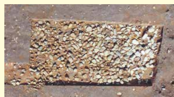
写真4 調査区南側石敷確認状況 道路に伴う石敷は、10センチ前後の石を中心に3 ~15センチの石が整地層の上に敷かれていました。

車宿は東西4・6メートル(2間)、南北 27・5メートル(10間)で南北方向に細長い 建物です(牛車10台分)。 詳しい資料を得るため、車宿の北 端と、北から5番目の柱付近を調査 しました。北端では雨落溝が車宿を 囲む様子を、5番目の柱付近では柱 そのものを確認しています。現在地 上に短い丸太を建てて柱の位置を 表していますが、その真下の地中に 確認した実際の柱の太さは30センチ程 で堂々としています。南側の調査区 では石敷の道路面が見つかってい ます(写真4)。