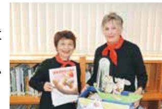
「たろうアンドはなこ」の皆さん

12月11日(土)11:00から町立図書館児童コーナーでお話の会「たろうアンドはなこ」の皆さんによる、楽しいおはなし会を行います。親子やお友だち同士で、ぜひお越しください。