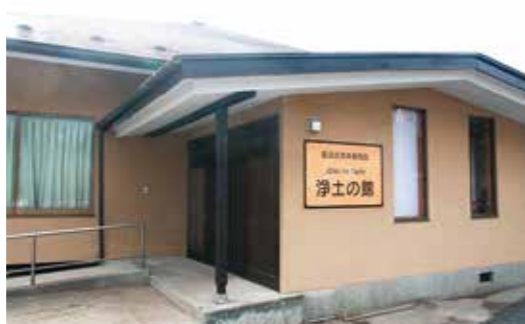
宿泊交流体験施設「浄土の館」

宿泊交流体験施設「浄土の館」 次期指定管理者を公募しています 令和4年6月30日に指定管理期間が満了する宿泊交流体験施設「浄土の館」について、次期指定管理者を募集しています。 ■ 施設所在地 岩手県西磐井郡平泉町平泉字毛越248番地 ■ 次期指定管理期間 令和4年7月1日から令和9年3月31日までの4年9カ月を予定 ■ 応募期限 ：12月28日(火)まで ■ 申請書の提出方法 まちづくり推進課に持参または書留郵便による郵送(最終日午後5時必着) ※FAX、電子メールでの申請は受け付けていません。 ■ その他 詳しくは平泉町ホームページを