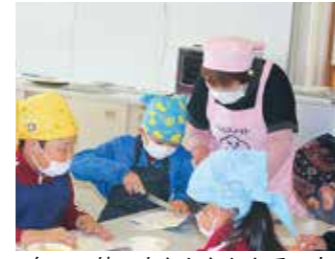
包丁の使い方なかなか上手です

3、4年生は、総合的な学習で長島のリンゴについて学習活動をしました。11月10日に