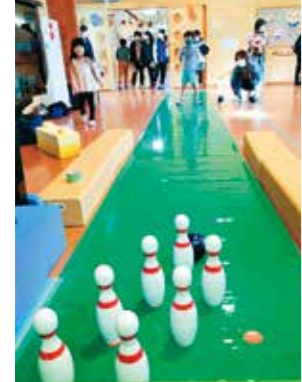
ニュースポーツを楽しむ子どもたち