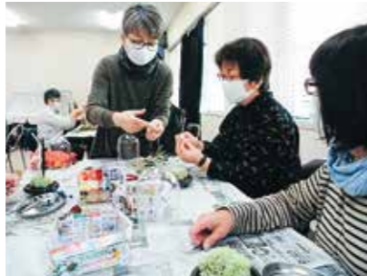
きめ細やかな指導中

10月27日、受講生12人は、花材選びからアレンジまで、それぞれの感性を生かして、素敵なガラスドームを完成させました。