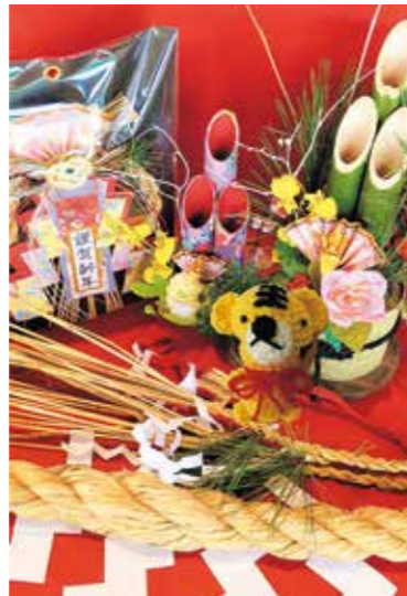
正月飾りのイメージ画像

【産直売り場12月のお薦め品】 ■正月飾り 年末年始の準備に向けて長島クラブの皆さん が丹誠込めて作った正月飾りなどを展示販売し ます。気に入ったものをその場で購入できます ので、ぜひ見に来てください。 ■販売時期：12月10日頃から