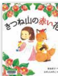
「きつね山の赤い花」 えがしらみちこ/マイクロマガジン社