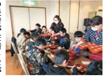
わんこそばを食べました

1日目、宮沢賢治童話村では、学習発表会で演じた宮沢賢治の世界について、さらに学習を広げることができました。この日の昼食は、わんこそば。初めてわんこそばを食べる子もいて次から次へと出されるわんこそばを思う存分楽しむことができました。中には、100杯以上も食べた子もいました。