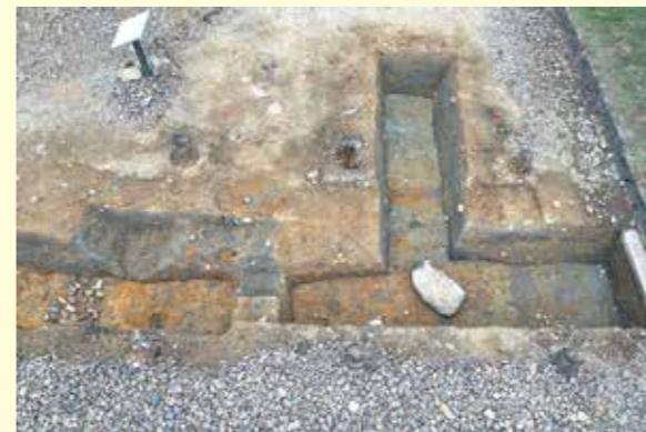
写真2 車宿北端の調査区(南から撮影) 西側では車宿の雨落溝が見つっています。幅 70センチ程あり、15センチ位の小石が埋まっています。

本年度の調査は親自在王院西側の車宿とその周辺 で行いました。この場所は昭和52年に一度調査が行わ れており、車宿と道路跡が発見されています。 車宿は牛車(貴人の乗り物)の駐車場のことで、鎌倉 時代の歴史書「吾妻鏡」には、「親自在王院の西面には 南北方向に並ぶ数十の車宿がある」と書かれていま す。今回、車宿の再調査を行っており、車宿に伴う柱根 と周辺の石敷の道路面を確認しました。