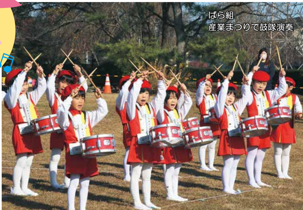
ばら組 産業まつりで鼓隊演奏