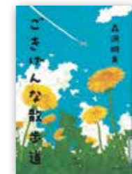
「ごきげんな散歩道」 森沢明夫/春陽堂書店