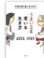
「不安と折り合いをつけて うまいこと老いる生き方」 中村恒子・奥田弘美/すばる舎