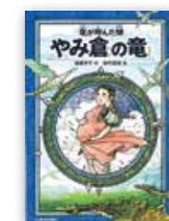
「竜が呼んだ娘 やみ倉の竜」 柏葉幸子/朝日学生新聞社