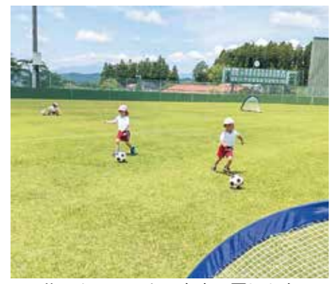
芝の上でサッカーをする園児たち

町立幼稚園、平泉保育所、長島保育所では、町教育委員会が主催する「出前スポーツ教室」のプログラムを活用し「キッズサッカー」を実施し、毎回スポーツ推進委員らをコーチに、観自在王院跡や園庭、長島球場で教室を開催しました。初めはサッカーボールを蹴るのをためらう園児もいましたが、コーチの指導のもと今ではボールに慣れ、一生懸命ボールを追いかけて、ゴール目掛けて力いっぱいシュートしています。