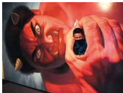
捕まった〜(トリックアート)

10月9日、塾生23人は、「えさし藤原の郷」でスタンプラリーや鎧の着付などを体験しながら園内を散策し、久しぶりの遠足を楽しんでいました。