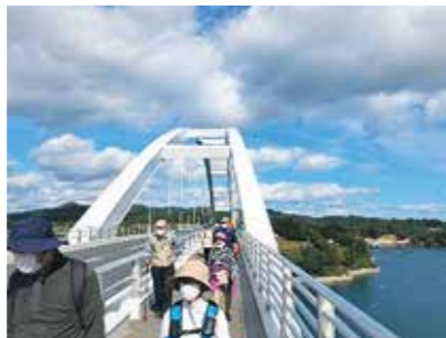
鶴亀大橋を渡って大島へ

10月22日、受講生12人で気仙沼大島を目指してウォーキングしました。秋晴れの気仙沼湾や大島瀬戸を眺めながら爽やかな汗を流しました。