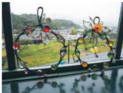
色とりどりのマーブル

受講生11人は、ビー玉をワイヤーで固定するのに苦戦しながらも、全3回の講座で個性あふれる素敵な作品を完成させました。