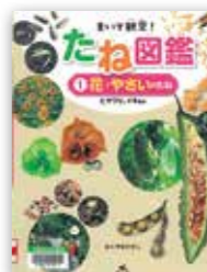
「まいて観察!たね図鑑」 おくやまひさし/汐文社