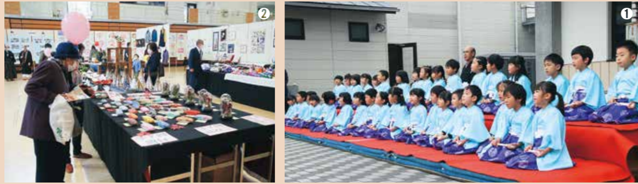
①平泉保育所・幼稚園の園児による謡の披露／②力作揃いの作品展示／③幼稚園舎の作品展示／④パパ♡イ～ヨの絵本の読み聞かせ／⑤takaTAKAαによるミニコンサート／⑥多くの人でにぎわった会場／⑦茶道の披露