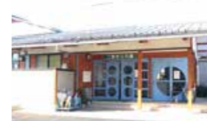
平泉保育所・幼稚園