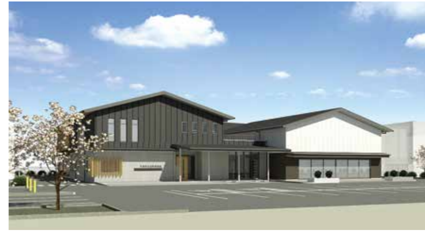
社会教育施設の完成イメージ