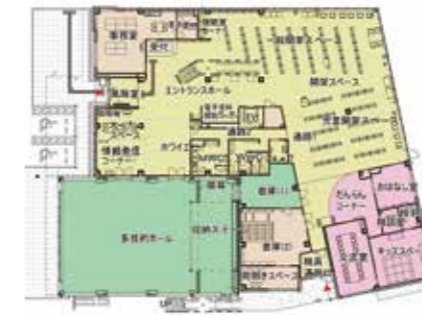
社会教育施設の1階フロア

(仮称)平泉町社会教育施設 愛称を募集します 令和4年7月にオープン予定の「(仮称)平泉町社会教育施設」は、公民館、図書館を集約し、合わせて子育て支援機能、多目的ホール機能を備えた複合施設で、賑わいのまちづくりを支える、町民の学習、交流拠点として、町の中心部に整備しています。 この新しい施設が、大勢の皆さんに親しまれ利用してもらえるよう、広く愛称を募集します。