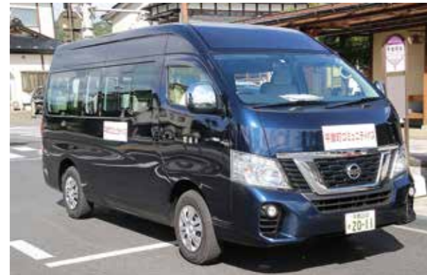
平泉ルートの車両(青)

バス停の場所と時刻表については、町ホームページまたは広報5月号(No.767)をご覧ください。