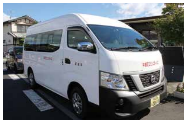
長島ルートの車両(白)