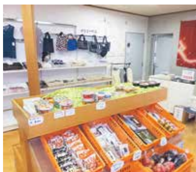
施設内にオープンする売店

■営業日 「悠久の湯平泉温泉」開館日の月曜日・金曜日 ■営業時間 ：午前11時～午後2時