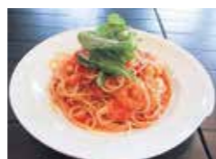
▲人気メニューのパスタ ▶花巻市大迫にある店舗