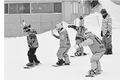
まずは雪に慣れる練習から

初めて参加した受講生たちも、講師のアドバイスを聞き、回を重ねるごとに上達。みんなで楽しみながらウインタースポーツを体験しました。