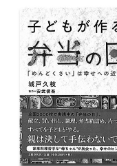
「子どもが作る弁当の日」 城戸久枝/文藝春秋