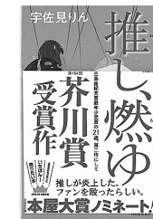
「推し、燃ゆ」 宇佐見りん/河出書房新社