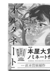
「オルタネート」 加藤シゲアキ/新潮社