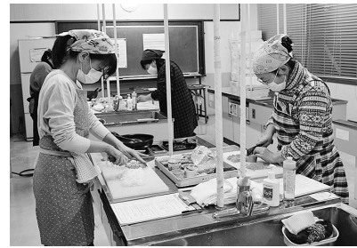
材料のみじん切りから始めました

レタスこんぶとチョコチャンクスコーンも手軽においしく作れるレシピでとても好評でした。