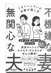
「不機嫌な妻無関心な夫」 五百田達成