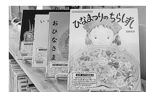
おすすめ児童図書コーナー