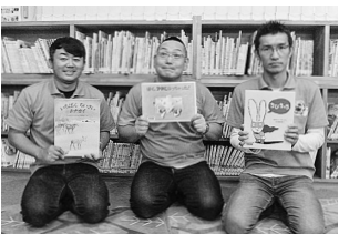
「パパ♡イ〜ヨ」の皆さん

3月13日(土)11:00から町立図書館児童コーナーでパパさん読み聞かせサークル「パパ♡イ〜ヨ」の皆さんによる、とても楽しいおはなし会を開催します。親子やお友だち同士で、おはなし会にぜひお越しください。