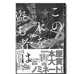
「この本を盗む者は」 深緑野分/KADOKAWA