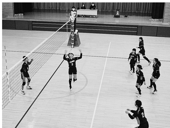
元気なプレーを見せた長島バレースポーツ少年団

第28回佐々木製菓杯一関地方小学生バレーボール大会が、2月7日に平泉小学校と中学校の体育館で開催されました。11チームが参加し、当町からは、平泉バレーボールスポーツ少年団、長島バレーボールスポーツ少年団が参加しました。例年男子・混合の部、女子の部に分かれて競技が進められていましたが、本年度は、参加チーム数の減少などから、男女の区別なくフリーでの競技となりました。予選リーグで、平泉バレーボールスポーツ少年団は、マリンバレーボールスポーツ少年団、萩荘黒沢バ