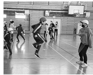
息を合わせてジャンプ!

本校の特徴的な活動の一つに「縦割り班活動」があります。すべての学年の児童で構成される班が14班あり、全校遠足などでは一緒にお弁当を食べたり、日常の清掃を一緒に行ったりしています。