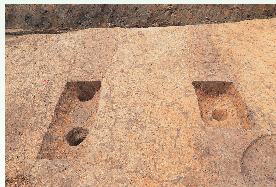
写真1 道路と並行に位置する堀の跡