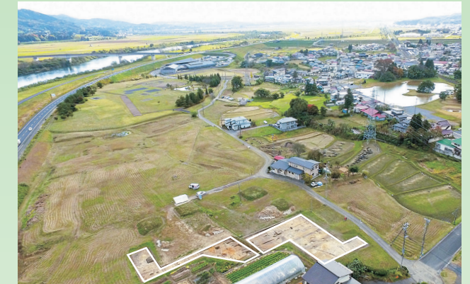
空から見た柳之御所遺跡(白抜き部分が調査区)

堀内部地区は『吾妻鏡』に記載される『平泉館』 あづまがき であると考えられ、12世紀奥州藤原氏の政庁(政治をする場所)の役割を果たしていたと推測されます。