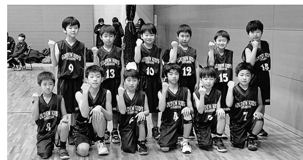
県大会で初戦突破した平泉 GOLDENKID'S の選手たち

参加した選手の保護者は「コロナ禍でいろいろな規制があり、練習が思うようにできなかったが、そんな中でも県大会で一勝できた