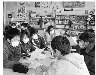
3学期の決意を発表しよう

卒業、進級まで全校児童で力を合わせ、「未来への準備期間を大切に過ごしていきたいです。」