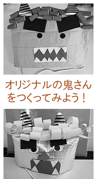
オリジナルの鬼さんをつくってみよう！