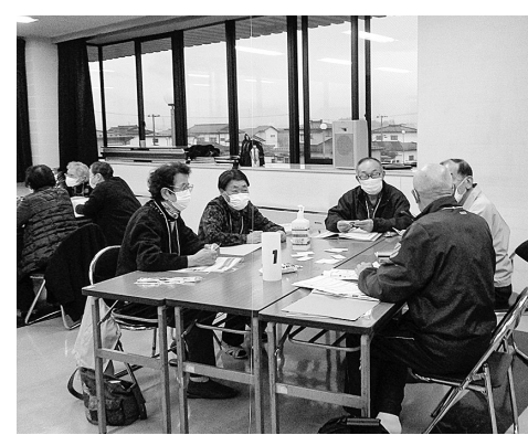
もしバナゲーム体験の様子

町では、在宅医療や介護についての理解を広めるため、昨年の11月より「だれでもわかる介護講座」を開催し、誤嚥性肺炎の予防のための口腔ケアを学んだり、足元から健康になるためにフットケアを学びました。講座の中では「人生会議」のきっかけのツールとして「もしバナゲーム」体験をしました。もしバナゲーム体験とは、余命わずかの想定をした時に「自分は何を大切にしたいか」、「どんな医療やケアを望むか」を考え、話し