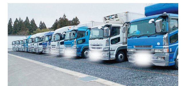
輸送用トラックの駐車場

今回、高田前工業団地の北東部分約1万3,000平方メートルを取得した事業用地には、2,826平方メートルの貸し倉庫棟をはじめ、事務所、車庫棟とトラックの駐車場が整備されました。貸し倉庫棟は、3つに仕切られた構造になっていて、うち1つが温度管理が可能な倉庫、他の2つの倉庫は内部でつながっていて一体的な利用が可能です。令和3年に開通予定の平泉スマートインターチェンジからも近い場所にあり、今後の新規の事業展開による利用が期待されています。