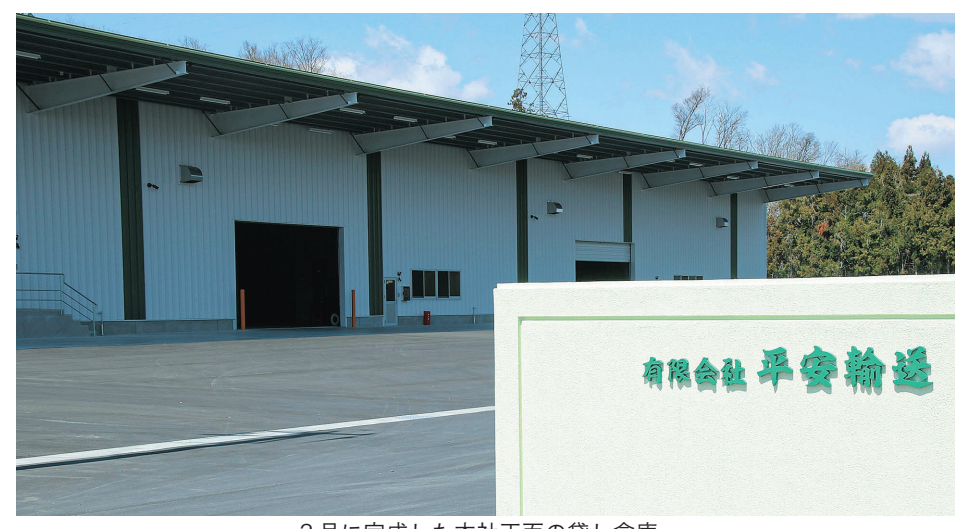
3月に完成した本社正面の貸し倉庫