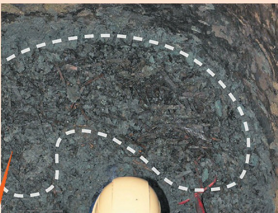
上/写真4 「ちゅう木」が出土した様子 写真3の穴からは「ちゅう木」のような木製品が大量に出土しました。白線で囲んだところは、ちゅう木がまとまっている範囲です。