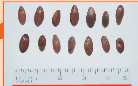
上/写真2 見つかった種 写真1の底近くに埋まっていた土には種がたくさん混じていました。当時の人が食べたウリなどの種が未消化のまま排泄されたものと考えられます。種が含まれた土を調べることで、当時の人たちの食生活を知ることができます。