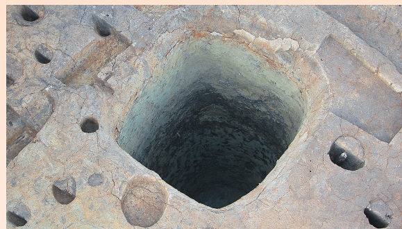
上/写真3 巨大な汚物廃棄穴？ 1辺が約1.8メートル、深さ約4メートル、四角い形の大きな穴で、井戸のような見た目や大きさです。当時の人たちが井戸を掘ろうとしましたが、水が湧かなかつたためにゴミを捨てる穴に使用方法を変えたのかもしれませんが、実際、底まで掘って数日経っても水はにじみ出る程度しか湧きませんでした。