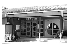
平泉保育所・幼稚園