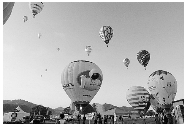
秋の空へ飛び立つバルーン