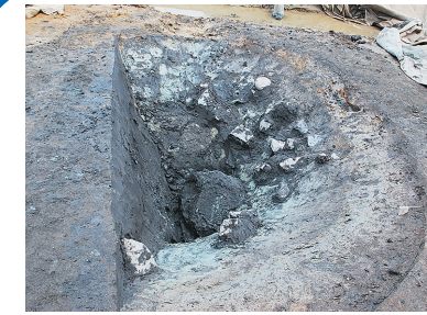
左/写真1 井戸跡から見つかった石 この井戸は直径が3尺30寸ほどあります。 中には大きな石が入っていて、掘る作業は大変です。井戸を埋める時に投げ込まれたものとみられます。

8月は主に調査区の西側(保健センター側)で作業をしました。西側でもたくさんの遺構が見つかり、8月号で紹介した井戸跡よりも規模の大きなものも見つかりました(写真1~3)。また、志羅山遺跡でも最大級の建物跡も見つかっています。(写真4)