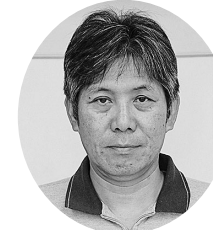
16区・21区 春日谷 一之杉