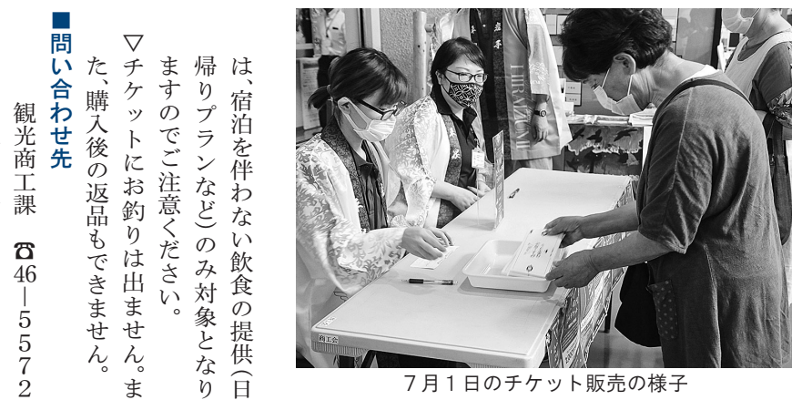
7月1日のチケット販売の様子

今年の水かけ神輿は中止 平泉総社神輿会が主催して毎年行っている「平泉水かけ神輿」について、新型コロナウイルス感染症の収束状況を踏まえ秋の開催を検討していましたが、感染拡大防止の観点から本年の開催は中止となりました。