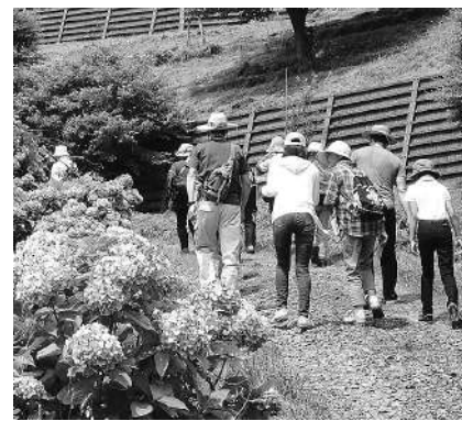
昨年のネイチャーウォーキングの様子