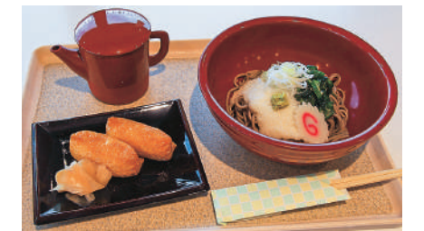
冷やしとろろそば【税込み750円】

気温が高くなるにつれ食欲がなくなるという人でも、とろろ、モロヘイヤ、オクラが入っていて食べやすい栄養満点のメニューなので、夏バテ対策にぴったりです。そばだけでは少し物足りない時もありなりずしが付いてくるのでボリュームがあります。ぜひお召し上がりください。