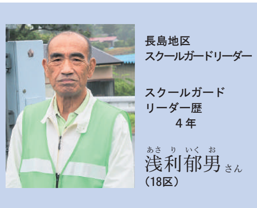
長島地区 スクールガードリーダー