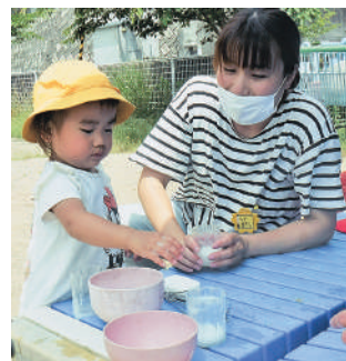
のびのびクラブに初参加

その後、幼稚園ホールでアンパンマン体操をして体をほぐし、園庭へ繰り出しました。夏のような日差しの中、ブランコやすべり台で元気いっぱい遊んだり、ボールと泡だて器をつかったおままごとで夢中になったりして、親子で楽しい時間を過ごしました。これから暑い季節になるので、7月は水遊びを予定しています。コロナ禍で、予定が変更になることもあります。参加でき