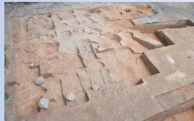
上/写真2 明治のお堂の下から江戸時代の礎石が見つかりました(南西から)

明治に建てられたお堂の解体後の状況です。54個(9×6列)の礎石が並んでいます。礎石の大きさは、大きいもので1m以上、小さいもので40cmでした。右側が正面側(南東側)で、建物の四隅や南側に大きい礎石を置いていることがわかりました。