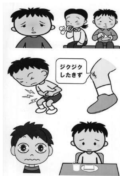
こんな時はプールに入れません

春先には、新型コロナウイルス感染症の蔓延が心配されていましたが、6月9日火曜日、全校の子どもたちが参加して、1校時に体育館で「プール開き」の式を実施しました。 式では、校長先生、体育担当の先生、養護教諭の先生から、水泳学習に臨む際の心構えや約束、注意点などについて話を聞きました。水泳学習が待ち遠しいのか、時折笑顔を見せる子がたくさんいました。 このあと2、4、6年生の代表が、今年の水泳学習で頑張ることをそれぞれ発表しました。6年生の代表は、「1000メートルを縮めること」と「背泳ぎで50メートル泳ぐこと」の2つを挙げていました。 今年の夏も暑くなることとが予想されています。事故なく、安全な水泳学習になること、そして、子どもたちに水泳学習ができる喜びを実感してほしいことを願い、職員室から子どもたちのがんばりを見守っていききたいと思います。