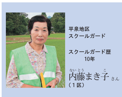
平泉地区 スクールガード

孫の小学校入学をきっかけにスクールガードを始めました。 担当する場所はバスに乗るために横断歩道を渡らなくては行けないので、横断時は車の動きを注意して見守っています。 夏休みなど長い休暇後は子供たちの気が緩む時期なので、各学期始めには交通安全教室を開催しています。 児童と大人がかかわる機会が少ないので、児童から名前を呼ばれ元気にあいさつされると嬉しいです。