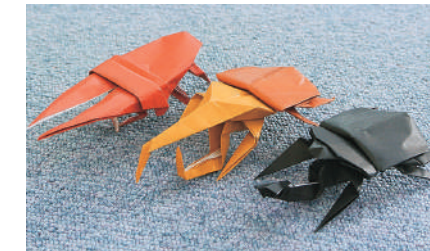
「ヘラクレスオオカブト」ほか

本を借りる時、お楽しみカードに1日1個スタンプをつきます。10個ためた人には「折り紙」、20個ためた人には「折り紙」または「ペーパークラフト」を差し上げます。プレゼントと館内装飾は、図書館職員の手作りです。