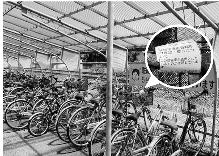
平泉駅駐輪場に長年放置された自転車