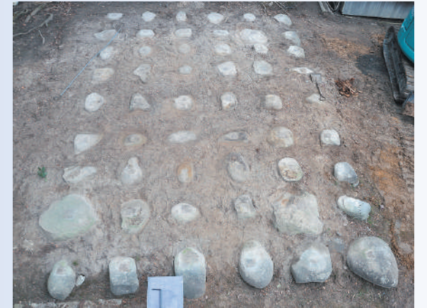
上/写真1 解体した明治時代のお堂の礎石(南西から)

明治18年に建てられたお堂の下から、江戸時代と考えられる礎石が7個見つかりました(写真2)。見つかった礎石は、明治のお堂が建てられるまであった前身のお堂ではないかと考えられます。