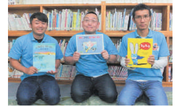
「パパ♡イ～ヨ」の皆さん

7月11日(土)11:00から町立図書館児童コーナーでパパさん読み聞かせサークル「パパ♡イ～ヨ」の皆さんによる、とっても楽しいおはなし会を行います。親子やお友だち同士で、おはなし会にぜひお越しください。※新型コロナウイルス感染症拡大防止に伴い中止の場合があります。