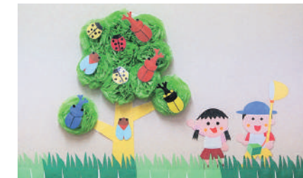
夏仕様の館内装飾

本を借りる時、お楽しみカードに1日1個スタンプをつきます。10個ためた人には「折り紙」、20個ためた人には「折り紙」または「ペーパークラフト」を差し上げます。プレゼントと館内装飾は、図書館職員の手作りです。