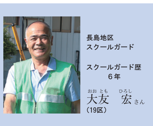
長島地区 スクールガード

担当する場所は、カーブで見通しが悪く児童の登校時間が出勤時間帯と重なり車通りも多い箇所です。 児童の安全を一番に気をつけているので、飛び出しや遊びながら歩くなど危険な時は注意することもあります。 1年続ければいいという思いから始めたスクールガードでしたが、児童の笑顔と元気なあいさつがうれしくて、無事何事もないようにと見守りを続けています。