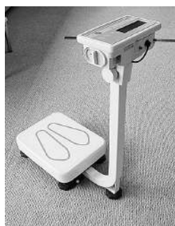
体重測定に使用するはかり