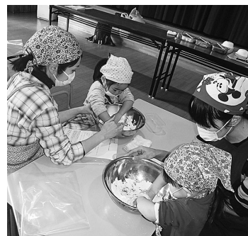
夢中でうどんをこねる子どもたち

しそうな子どもたちでした。時間のあるときにはお子さんと一緒に料理をする機会を作ってみませんか? 「一緒に作ったからいつもよりおいしい」苦手だったけど食べてみたい」など、いつもと違うお子さんの姿が見られるかもしれません。