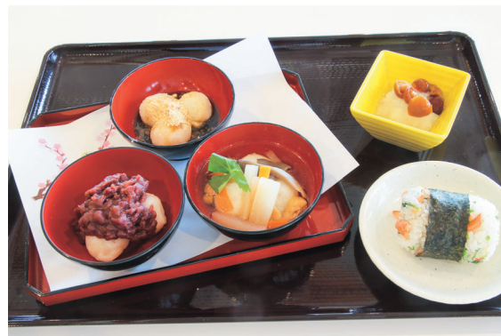
果報が当たった人には「コーヒー1杯」無料サービス