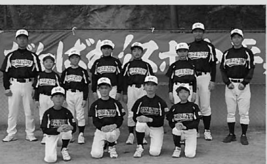
県大会での活躍が期待されるスポ少平泉

第33回全国スポーツ少年団軟式野球交流大会西磐井郡予選が5月7、8日の両日、一関市花泉町で開催されました。当町からはスポ少平泉クラブと長島ジャイアンツが出場。スポ少平泉クラブは、大会直前に2人のけが人を出し、9人での戦いとなりましたが準優勝を果たしました。