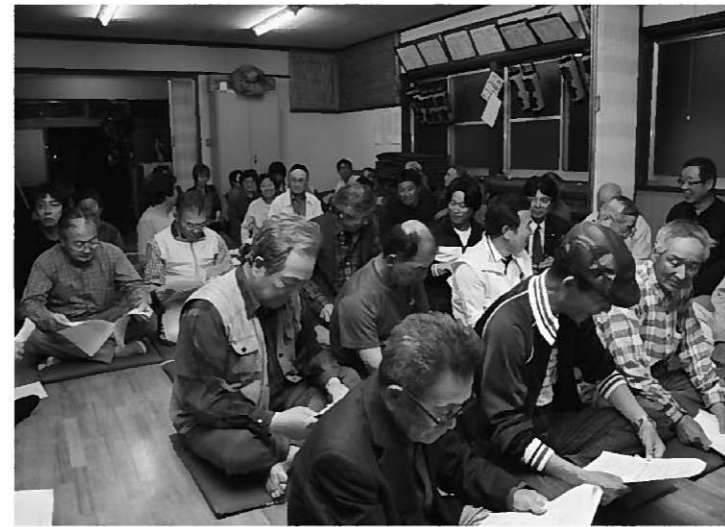
前向きな意見が寄せられた13区住民説明会(左) / 除外の勧告を受けた柳之御所跡(右上) / 文部科学省で開催された推薦書作成委員会(右下)