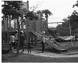
親子で楽しくすべり台