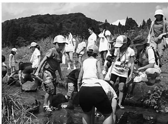
昨年のふれあい教室の様子

期日：7月2日～8月6日 毎週土曜日 全6回 時間：9時30分～11時30分 場所：町公民館1T室 内容：パソコンの基礎、メール、インターネット