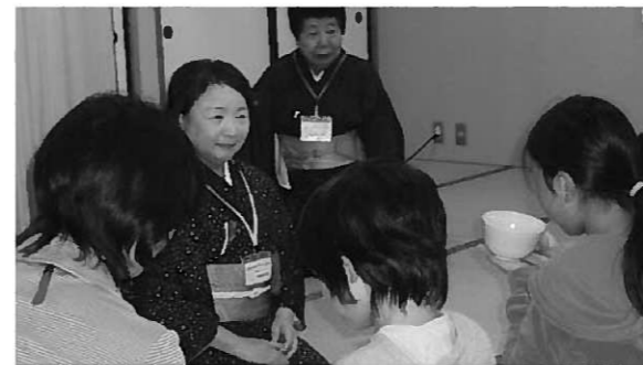
茶道体験で抹茶を堪能

日 時…毎週月・木曜日の放課後～16:00ごろ 場 所…長島小学校校庭・体育館・ミーティングルーム・家庭科室など