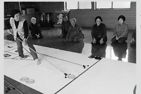
どの世代にも好評のシャッフルボード教室

費用 ：無料 申し込み方法 ：希望のメニューを選び、開催希望日の3週間前までに教育委員会へお申し込みください。