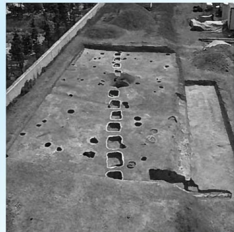
調査区全景 (遺跡西側から撮影)