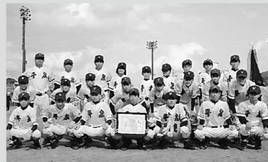
初優勝を果たした平泉中のメンバー