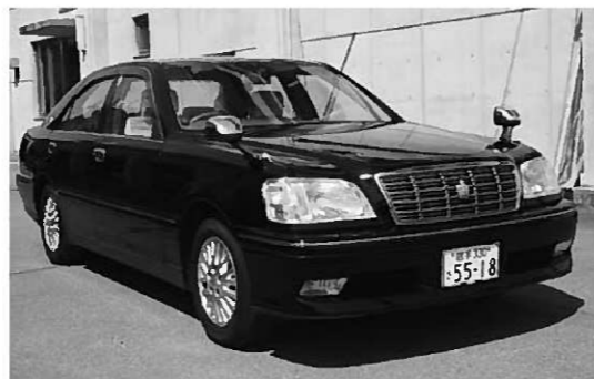
公売される町長車