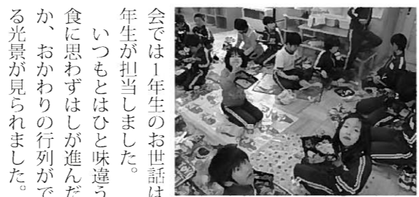
緊張した面持ちの新1年生

関心と期待の高さを 感じました 4月16日に行われた授業参観とPTA総会の保護者の出席率は、限りなく100%に近いものでした。このことは町P連総会でも話題となり、平泉町全体が学校教育にきわめて関心が高いことを再認識させられました。