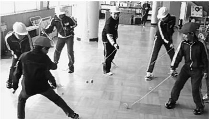
だれが1番上手かな？