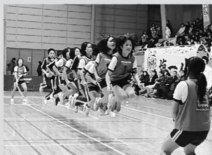
▶3分間全力で跳びきったHIS25チーム

「町総合型地域スポーツクラブ設立準備委員会（仮称）」では昨年に続き、子どもたちに「1本のロープで結ばれる友情のきずな」を体験してもらおうと、第2回パナソニックキッズスクールCUP「ロープジャンプ小学生大なわとびナンバ11決定戦」東北地区予選大会に出場しました。