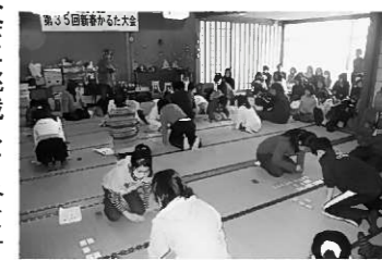
昨年度のかるた大会の様子

毎年恒例の新春かるた大会を開催します。冬休みにかるた教室に参加した人やお正月にお家で練習した人、大会に挑戦してみませんか。 期日：2月11日(金・祝) 時間：【受付】9時 【開会】9時30分 場所：老人憩の家「延年荘」 対象：高校生以下の児童生徒 競技：4つのクラスで競技 【A級】選手権(中学・高校生) 【B級】小学5～6年生 【C級】小学3～4年生 【D級】小学2年生以下 編成：【A・B・C級】個人戦 【D級】2人で1チーム 参加費：無料(昼食は各自持参) 申込期限：2月4日(金)