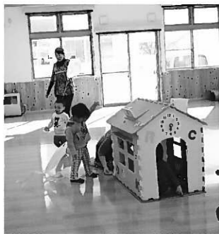
広いホールでなかよく遊ぶ

☆正月遊びを満喫☆ 1月のなかよしサロンは、長島公民館を会場に、5組の親子で子ども6人の参加があり、お正月遊びをしました。 牛乳パック製の羽子板やこまを用意し、興味を示した子どもたちが挑戦していました。 またビニールのレジ袋でたこを作成し、出来上がった順に、ホールの中を走ってたこ揚げをして楽しみました。