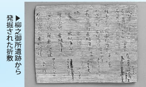
▶柳之御所遺跡から発掘された折敷