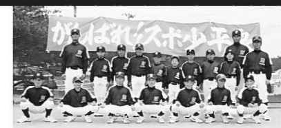
一緒に野球をしよう！