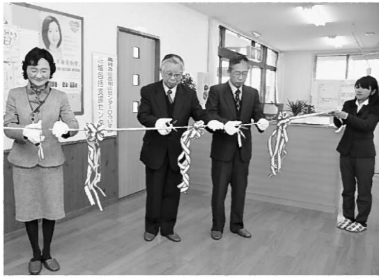
関係者らがテープカットでオープンを祝った

一関地区広域行政組合では、高齢者が住みなれた地域で暮らし続けることができるよう、介護予防や地域の高齢者の総合的な相談の拠点として平成18年度から、一関西部地域包括支援センターと一関東部地域包括支援センターを設置しています。