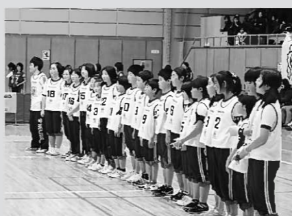
▶緊張した表情のHYK23チーム

「ポイント」の合計得点で競い合う競技です。参加応募のあった平泉小の5～6年生48人を「HIS25」チームと「HYK23」チームの2チームに編成。同大会での優勝を目指し11月25日から練習を始め、冬休み期間中も連日練習を積み重ねました。両チームとも最初は20回ほどしか跳ぶことができませんでしたが、跳び方やロープの回し方をみんなで考え、お互いに励まし合いながら練習することで、大会前日まで