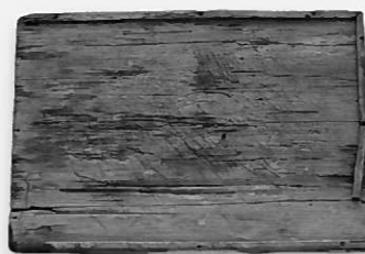
▶志羅山遺跡から発掘された折敷