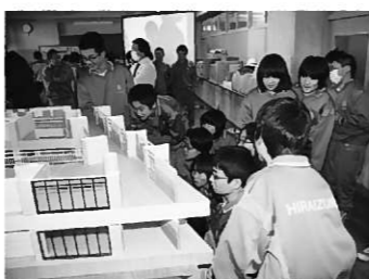
模型でホールをイメージする生徒たち

12班に分かれ、香港大学の田代久美先生、東北大学准教授の平野勝也先生の指導と東北大学の4