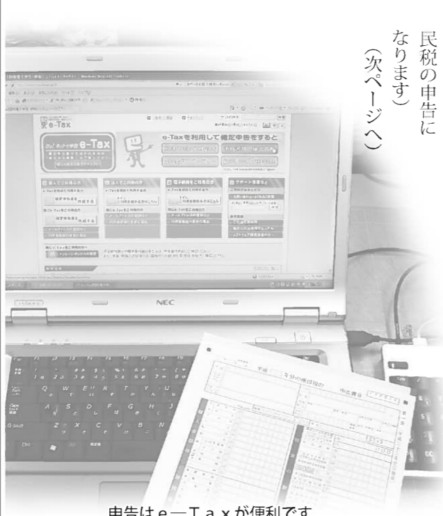
申告はe-Taxが便利です

▽給与所得や退職所得以外の所得金額が20万円を超える人(20万円以下の人は町県民税の申告になります) (次ページへ)