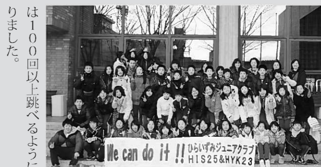
東北地区予選大会を終えた子どもたち