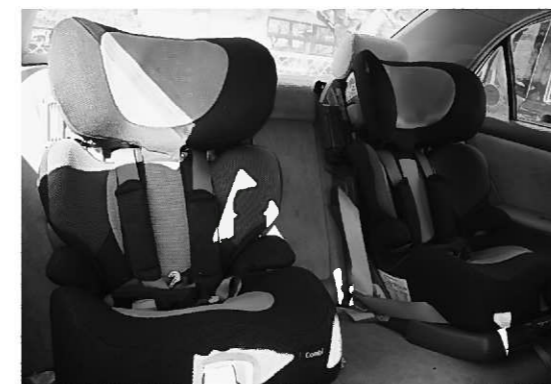
チャイルドシートは大切な子どもの命を守ります

▽ベランダの柵のそばや窓の近くに踏み台になる物を置かない。 ▽床には口に入りそうな小さな物は置かない。 ▽化粧品や刃物などをしまった引き出しにはロックを掛ける。 ▽口にものをくわえたまま遊ばない。(特に棒付きの菓子やはしなどの細長い物) ▽外出して遊具(すべり台など)で遊ぶときは、一人で遊べていても近くで見守る。