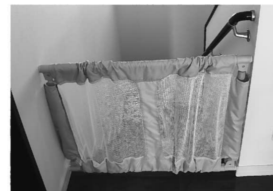
階段には転落防止の安全柵を付けましょう

▽チャイルドシートやジュニアシートを必ず着用する。 このほかに、道路では必ず手をつなぐことなど普段の生活の中で、予防できる対策は数多くあります。「子どもには元気で早く育ってほしい」というのは親や家庭、地域にとって1番の願いです。 みんなで子どもの事故を防ぎましょう。