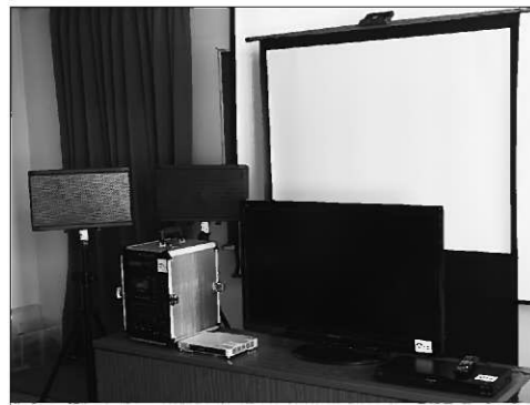
宝くじ助成金で整備された視聴覚資機材