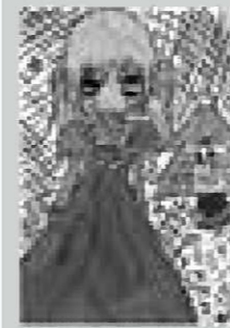
▲ペンネーム・さえぼん