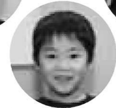
仮面ライダーオーズ 浅井遙斗