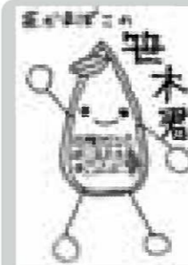
▲ペンネーム・一期一会