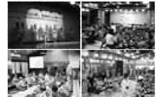
厳粛な開会とセレモニーの後は、謡あり踊りあり寸劇あり手品、カラオケなどで楽しい宴会