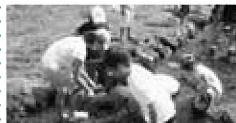
イワナを捕まえるぞー！

町公民館青少年事業「わんぱく塾」第4回を9月4日、奥州市大森の「ふるさと自然塾」で開催し、イワナつかみ体験に挑戦しました。今回の体験には31人の児童が参加。児童全員で沢の中に裸足で入りましたが、イワナは隠れたり逃げまわったりとみんな悲戦苦闘。ようやく捕まえた魚は、子どもたちの手で調理し、塩焼きにして食べました。獲れたての魚の味はやはり格別な様子で、みんな美味しそうにイワナにかぶりついていた。イワナを捕まえるぞー！