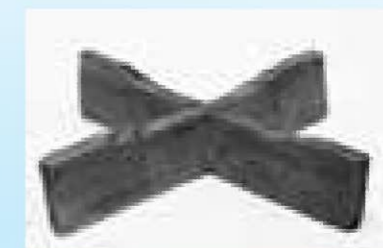
志羅山遺跡から出土した燈台(写真1)