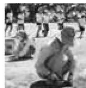
ボランティアによる除草作業

ほかにもいろいろお世話になってます。「登下校の見守り」では、おかげさまで事故なく安心な毎日です。自分から進んで大きな声であいさつする子も多く、先日は「元氣なあいさつで、気持ちがいいです」とお褒めの電話をいただきました。高学年の家庭科では、ミシンの学習でボランティアをお願いしました。技能の指導は、担任一人ではとても難しいです。ボランティアの方がいることで子ども