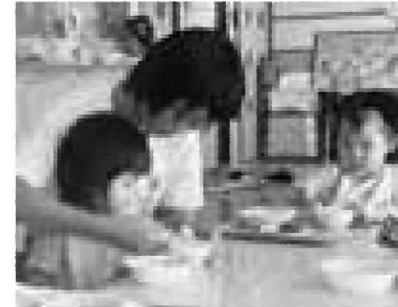
二葉きり園での体験学習の様子

どの生徒も将来の自分の生き方を真剣に考える貴重な体験となったようです。なお11月には、職業について「父母から学ぶ会」を開催します。