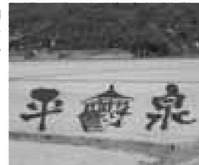
高館橋東側のほ場にくっきりと浮かび上がる「平泉」の文字と金色堂覆堂