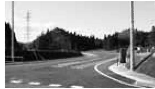
◀壱石線の開通により戸内地区と達谷地区が1本の道路で結ばれた