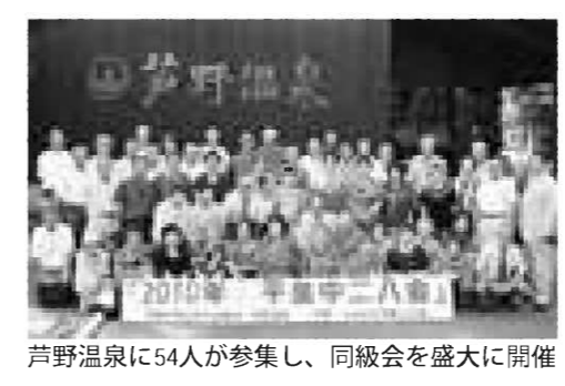
芦野温泉に54人が参集し、同級会を盛大に開催