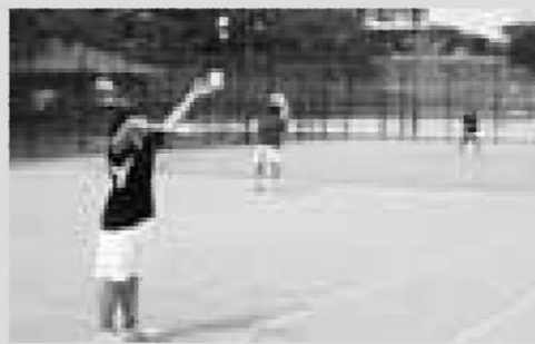
熱戦が繰り上げられたソフトテニス競技