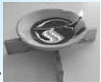
複製された燈台で当時を再現(写真2)