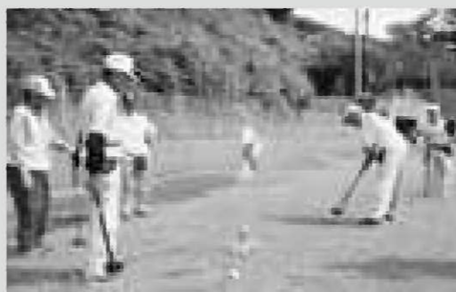
白熱したグラウンド・ゴルフ大会

問い合わせ先…バドミントン協会事務局・千葉(役場建設水道課内☎46-5569)または行政区のスポーツ推進員まで。