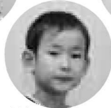
仮面ライダーオース 大内 空