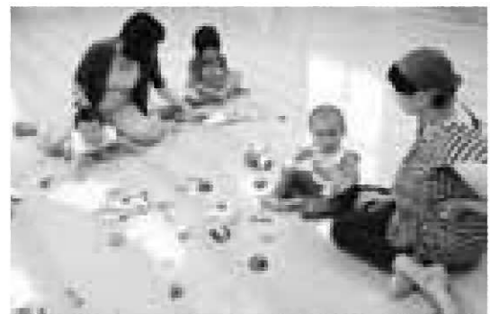
広い公民館でのびのびと

▽子育て支援センター 毎週月・金曜日 今月より左記の通り年齢別の日(午前中)を設けました。 ☆0、1歳児：毎週月曜日 ☆2歳児以上：毎週水曜日 ※設定日以外でもこれまで通り自由にご利用できます。 ※なお園行事などにより、変更する場合がありますので、ご了承ください。 ◎のびのび広場 5日(火) ◎いちごクラブ 12日(火) ◎なかよしサロン 15日(金) ◎のびのびクラブ 19日(火) ◎ピヨピヨ広場 26日(火) ◎給食試食会 28日(木) 問い合わせ先 子育て支援センター(平泉保育所内) ☎46-2767