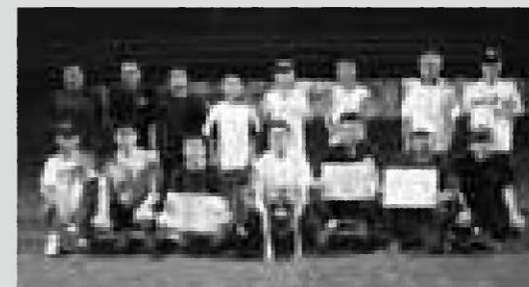
連覇を果たした11区選手の皆さん

いつき緊迫した試合展開となりました。11区が最終回に奪った追加点を守りぬき、大会2連覇を果たしました。大会結果は次の通りです。