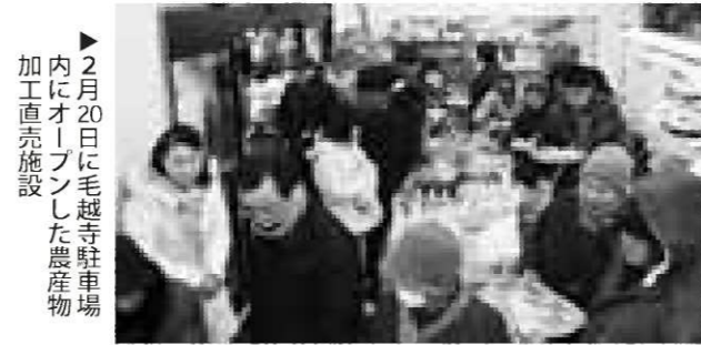
▶2月20日に毛越寺駐車場内にオープンした農産物加工直売施設