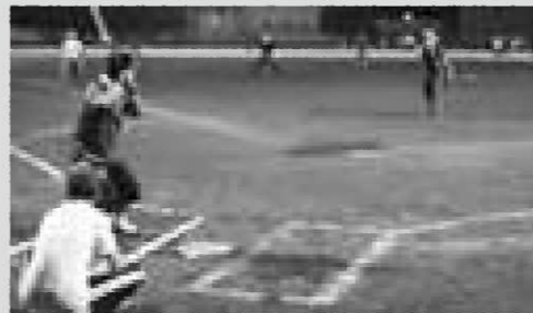
連夜の熱戦が繰り上げられた

町教育委員会が主催する壮年ソフトボール大会が8月30日～9月2日にかけて、長島球場で開催されました。毎年ほとんどの行政区が参加する同大会は、今年で26回目。今年は全行政区から約400人が参加し、声援や笑いの絶えないにぎやかな大会となりました。決勝まで勝ち進んだのは、攻守のバランスが取れた11区と、打撃力が売りの13区。3回を終わって13区が3点リードしていましたが、4回に11区が同点に追