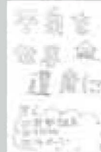
▲ペンネーム・一期一会