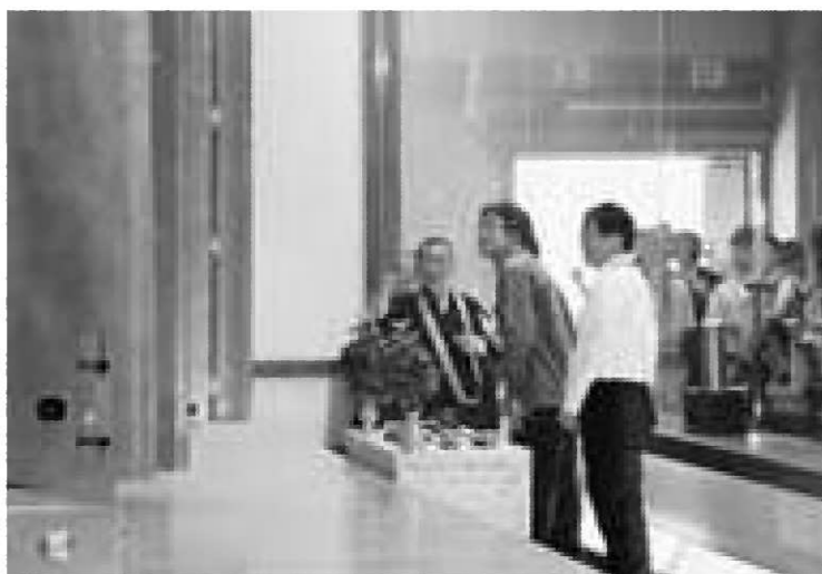
金色堂ではガラススクリーン内で調査