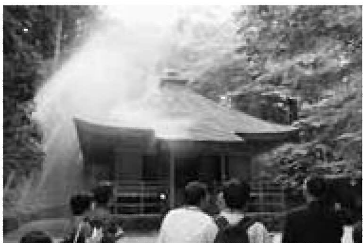
中尊寺経蔵では防火設備のドレンチャーによる放水を実演