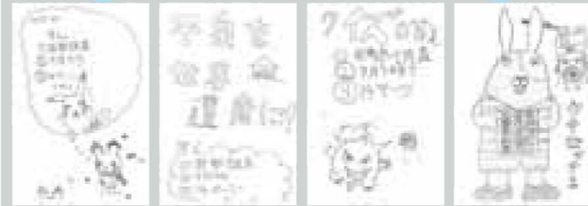
▲ペンネーム・I♡Y♡ ▲ペンネーム・一期一会 ▲伊藤大翔さん(10区) ▲原田総河さん(9区)