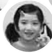
フリキアのキュアサンシャイン あざり 結愛