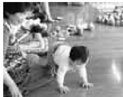
伸び伸びと遊びました

久しぶりに参加した5月に3歳になったばかりのお友だちの「3歳になったら...」というエピソードを、おばあちゃんが披露して、みんなで大笑いしたりと和やかに過ごしました。 ◎おねがい 子育て支援センターでは使わ