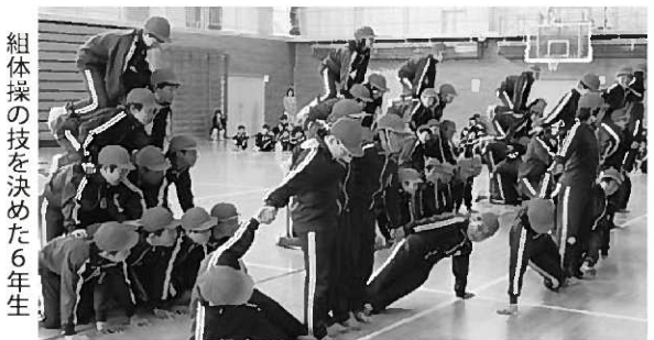
組体操の技を決めた6年生

ちゃん」と仲間作りゲームで、全校のみんなが大いに楽しみました。子どもたちは、うまくできるとハイタッチで歓声を上げ、なかには飛び上がって喜びました。うまくできないときには、「ドンマイ」「残念だったね」と声を掛け合っている姿が、思いやりの温かい心が通い合い、仲良しの大きな輪が体育館いっぱい広がりました。