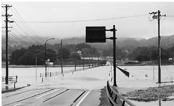
平成19年9月の豪雨災害