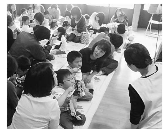
乳幼児を対象とした歯科指導の様子

を進める保健指導が柱になっていきます。生活習慣病や寝たきり予防のための各種教室を左表の通り開催しますので、ぜひ皆さんお気軽にご参加ください。