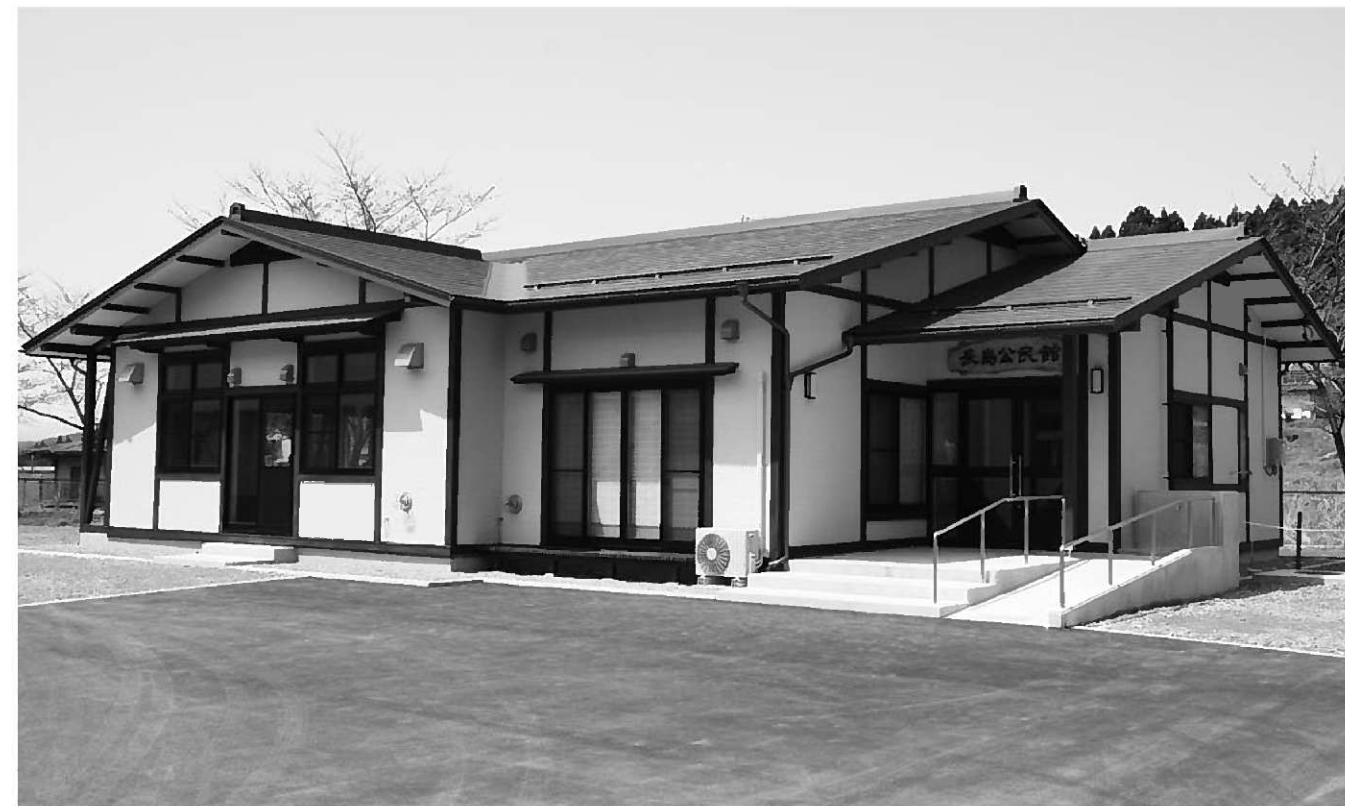
長島体育館北側に建設された長島公民館。玄関ポーチにはスロープが設置されている