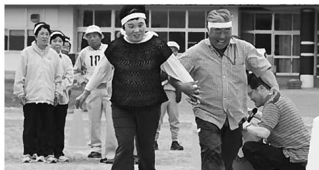
昨年のシルバースポーツ大会の様子