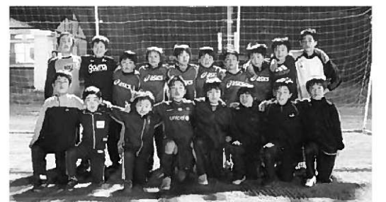
平泉フットボールクラブのメンバー

千葉監督は「サッカーを通じ、礼儀正しくあいさつなどができる選手になってほしい」と今後の成長に期待を寄せていました。