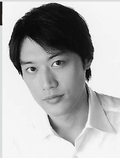
源義経公にふんする 俳優 うちだ あさひ 内田朝陽 さん