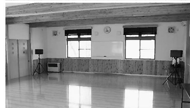
上 関係者によるテープカットで完成を祝った落成式／ 下 100人規模の会合にも対応できる広々としたホール

長島地区の生涯学習の拠点として昨年12月から建設を進めてきた平泉町公民館長島分館（通称「長島公民館」）が完成し、4月19日落成式が行われました。落成式には、町議会議員や行政区長、関係団体の代表者らが出席し、式典終了後にはアトラクションとして、三絃響の会の三味線演奏とお手玉会による踊りが披露され完成を祝いました。この施設は、長島体育館に隣接して建設されており敷地面積は1402平方メートル、木造平屋建てで床面積約173平方メートル、96平方メートルのホールや24平方メートルの和室などで構成されており、車椅子