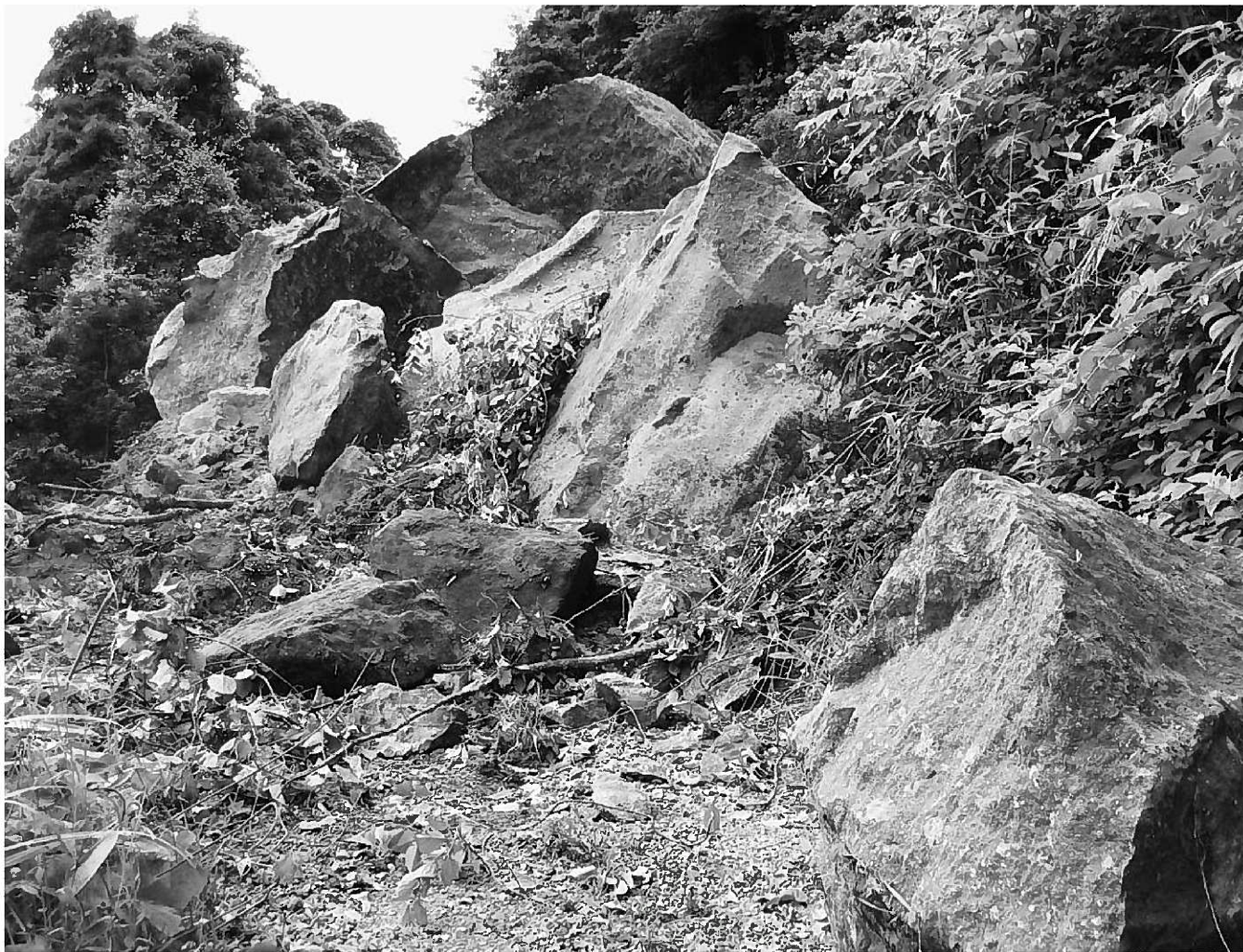
平成20年6月の岩手・宮城内陸地震により岩山が崩落し寸断された町道南郷線