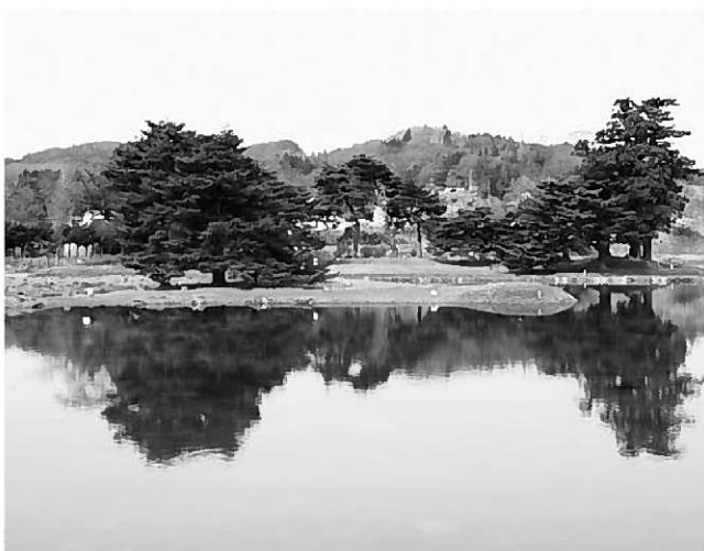
満々と水をたたえた「梵字池」。水面に金鶏山の姿が映り、夕陽が沈むころには神秘的な雰囲気が辺りに漂います

された無量光院跡の景観は、一般の方々からも好評を頂いています。当初想定された漏水も発生しないことや、より多くの方々から意見を求めるため、連休が終わる5月5日まで、池の状態を維持することになりました。町では今回の結果を精査し、県教育委員会と協議の上、イコモス現地調査の際の対応を検討します。