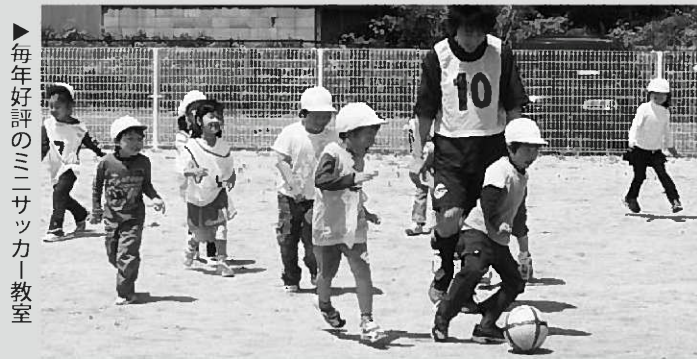
▶毎年好評のミニサッカー教室