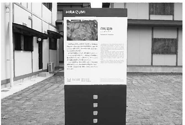
基金を活用して設置した史跡説明版(倉町遺跡)