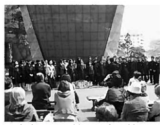
東京タワー前での合唱披露

3年生は、世界遺産登録を目指す平泉の中学生として修学旅行2日目の14日、東京タワーで約2時間にわたって平泉文化のPR活動を行いました。晴天の下、タワー前の広場で、美術部が作成した紙芝居やパネルを使い平泉文化を紹介し、選択教科で1年間練習した達谷窟毘沙門神楽と全員での「平泉伝説」の合唱を披露し、観光客の方から大きな拍手を頂きました。神楽は大展望台でも発表し、外国人観光客が足を止めて最後までじっくりと見ていました。舞