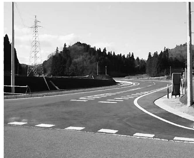
平泉蔵美溪線とつながった町道髭石線

戸河内地区と達谷地区を結ぶ町道髭石線が4月1日に開通しました。髭石線は、これまで道幅が狭くこう配が急な道路の利用を余儀なくされていた戸河内地区住民の安全な通行ルートの確保が目的です。6年度に事業を着工し、18年度には戸河内線から日向線までの約2・7kmが開通。今回の完成で総延長約3kmの通行が可能となりました。この全線開通により戸河内地区が主要地方道平泉蔵美溪線まで1本の道路につながり、交通の安全確保と利便性の向上が期待されます。