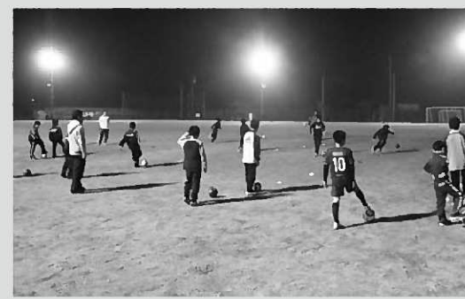
照明の下でサッカー練習をする子どもたち

千葉監督は「サッカーを通じ、礼儀正しくあいさつなどができる選手になってほしい」と今後の成長に期待を寄せていました。