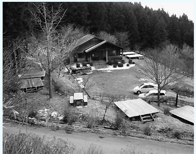
テントデッキなどが新しくなった大文字キャンプ場

(鈴) いたし ます。 皆さま のご指 導をま かりま すので 、いり ます。 指し頭 張って りよい いりま す。▽ いてい ます。▽ こする 日々が 続い ていま す。▽ 画面と にらめ つパソ コンの 編集 ン1年 目とし てまし た。▽ した。▽ するこ とにな りまし た。▽ らいた す。▽ 4月か ら広報 ひらい ずみNo. 635を 担当し ます。