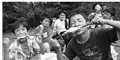
皆さんの笑顔が公民館の力!

月ごとのこの『公民館だより』をご覧いただき、体験したり、学んだりしてみたいと思っただけで、積極的に申し込んでいただきたいと思います。お待ちしています。