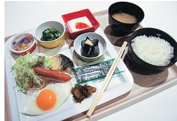
朝定食(和食)【税込み500円】