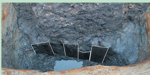
井戸跡内部の様子(西から撮影) 四角形の井戸枠の西辺が見つかりました。白い線で囲った部分が井戸枠の板です。1辺当たり5枚の板で作られていたようですが、左から2枚目は見つかりませんでした。