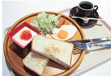
朝定食(洋食)【税込み450円】