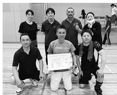
優勝した2区チーム