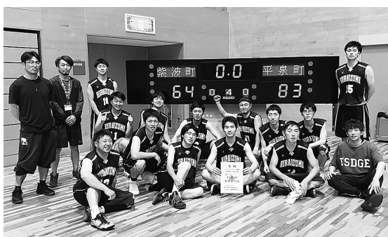
初優勝した平泉町チーム

1回戦目は山田町と対戦し67-51と勝利。続く準決勝では雫石町と対戦し、76-72の接戦で勝利。決勝戦は、8年連続優勝の紫波町と対戦。序盤から巧みな試合運びでリードを広げ、83-64で見事勝利し、大会初優勝を勝ち取りました。