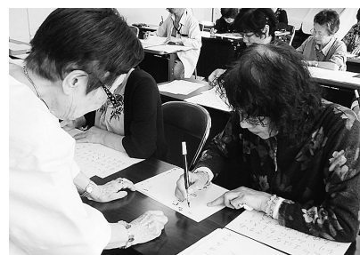
丁寧に練習しています