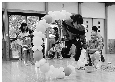
回転しながら浮かぶ風船にジャンプ