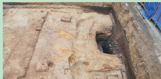
調査区東側の全景(南から撮影) 写真中央の深いところが井戸跡です。東側(写真右側)の調査区外まで広がります。

今回の調査で見つかった井戸は四角形のものでした。井戸枠の幅は1辺当たり約1.5m、幅30cm、厚さ10cm程度の板を並べて作られていました。この井戸は、一度5m四方ほどの大きな穴を掘ってから中央付近に井戸枠を設置し、外側を埋め戻して使われていたようです。東側の半分は調査範囲外のため、今回調査できたのは井戸枠の外側だけでしたが、埋まっていた井戸枠の板の長さから、深さは3m以上になるようです。埋め土からは、かわらけや陶器などが出土しており、12世紀に使われた井戸と考えられます。