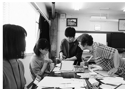
ここはこんな風に…