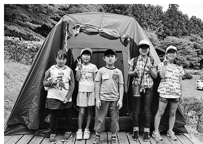
上手に張れました