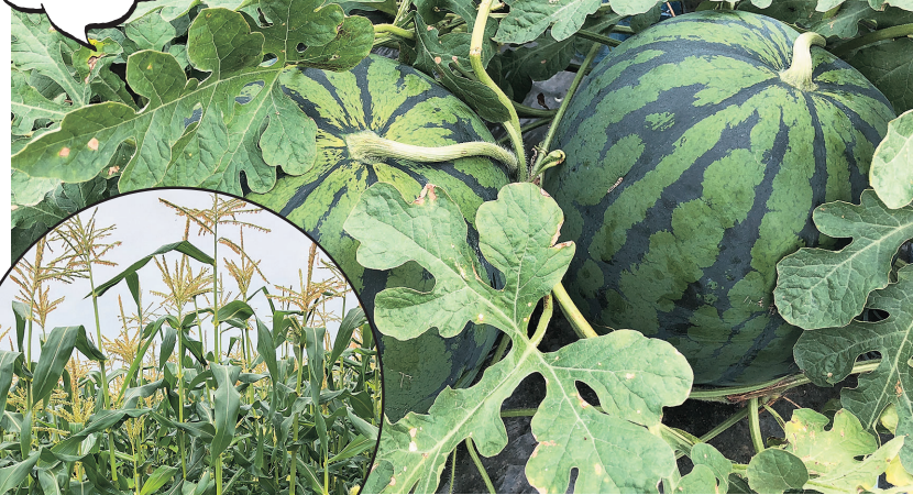
◀最高糖度は20度超えのとうもろこし。メロンに勝る甘さが人気の秘訣です。