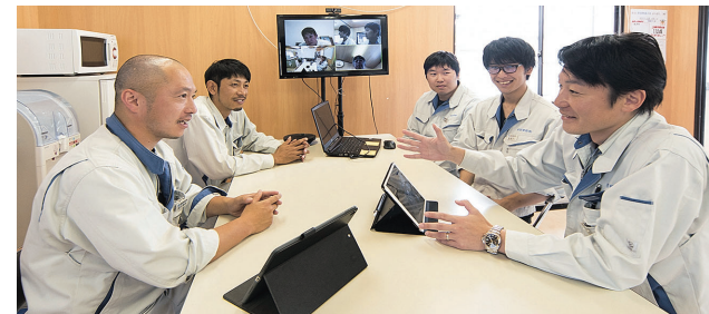
ipadを活用したコミュニケーションで業務品質の向上を図っています