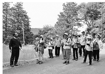
長島地区の歴史を学びながら…