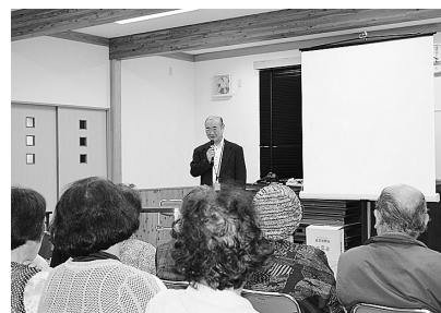
町立図書館長の講話