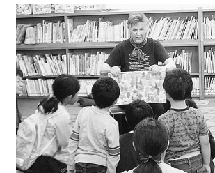
6月のおはなし会の様子

8月のおはなし会は8月17日(土)11:00からです。子育て支援ボランティア「かみふうせん」が出演します。