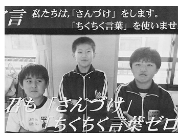
プロジェクトリーダーの子どもたち