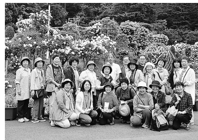
花巻のバラ園見頃でした