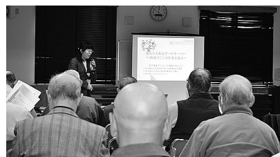
ゲートキーパーについて学んだ講演