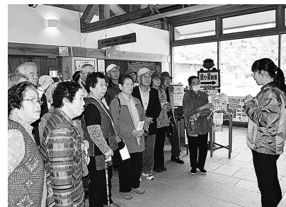
遠野ふるさと村にて

本年度の町外研修は10月17日、23日に遠野市を訪問しました。昭和初期にタイムスリップしたような景色の中で南部曲り家の見学や食事を楽しみました。また語り部による素朴で温かい方言での昔話体験など民話のふるさとを満喫してきました。