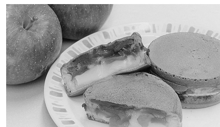
大文字りんごカスタード