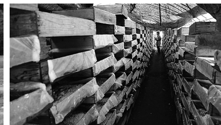
ヒラタケの栽培風景