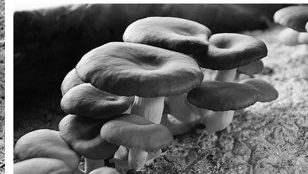
秋といえばキノコがおいしい季節