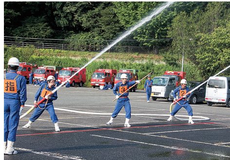
日ごろの訓練の成果を披露