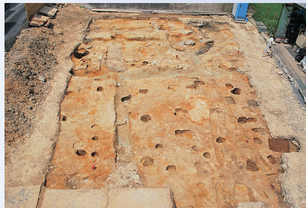
調査区全景(東から)

花立地内で、7月から8月にかけて発掘調査を行いました。その結果、調査区西側は後世に削られ、遺構が失われていましたが、東側を中心に12世紀と考えられる溝跡や建物跡が見つかりました。