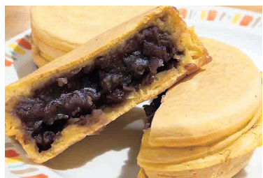
金色の大判焼き【120円(税込み)】

ブランド米「金色の風」の米粉を生地に練り込んだ大判焼きの販売を始めます 味は粒あんとクリームの種類で、もっちりとした生地と、ぎっしり詰まった中身が魅力です ■販売時期…9月20日～