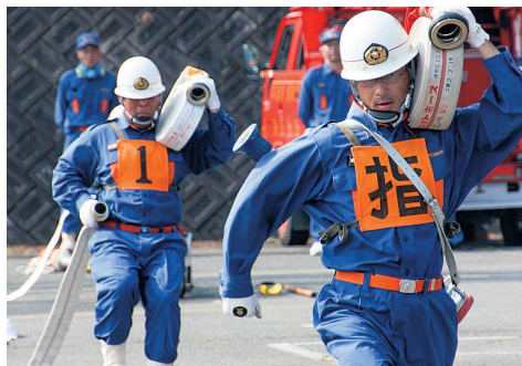
きびきびとした操作技術を行う消防団員

町消防団 消防操作法競技会 消防技術の向上と火災防止活動の徹底を目指した町消防操作法競技会が8月4日、町営中尊寺第2駐車場で開催されました。本年度の競技会には、町内全9分団の消防団員約110人が参加。ポンプ車操作法の部に3チーム、小型ポンプ操作法の部に6チームが出場して、操作技術を競い合いました。 競技は、ホースを延長し水槽にためた水をポンプで汲み上げ、火点となる標識に目掛けて放水。ポンプ操作や規律、敏しう性などの確かな動作について、