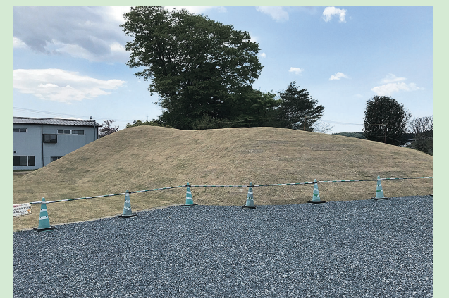
【写真2】修復された東土塁先端部(北から)

写真中央の砂状の溝が導水路。毛越寺の遣水とは異なり、石が使われていないのが特徴。7月1日から実際に水を入れて公開予定です。