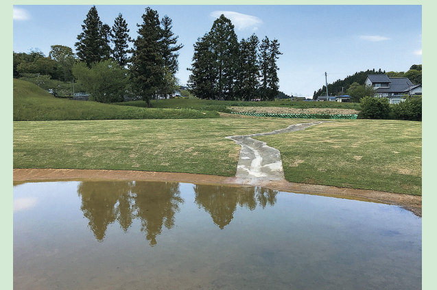
【写真1】復元された導水路(東から)

写真中央の砂状の溝が導水路。毛越寺の遣水とは異なり、石が使われていないのが特徴。7月1日から実際に水を入れて公開予定です。