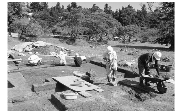
発掘調査の様子(中尊寺大池跡)