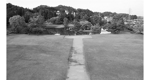
名勝「旧観自在王院庭園」