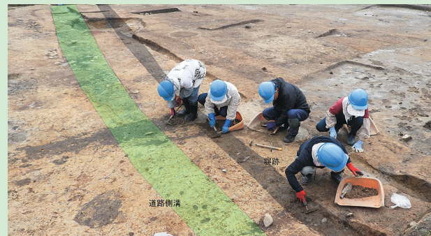
道路側溝と堀跡(作業員が堀跡を検出している場面)